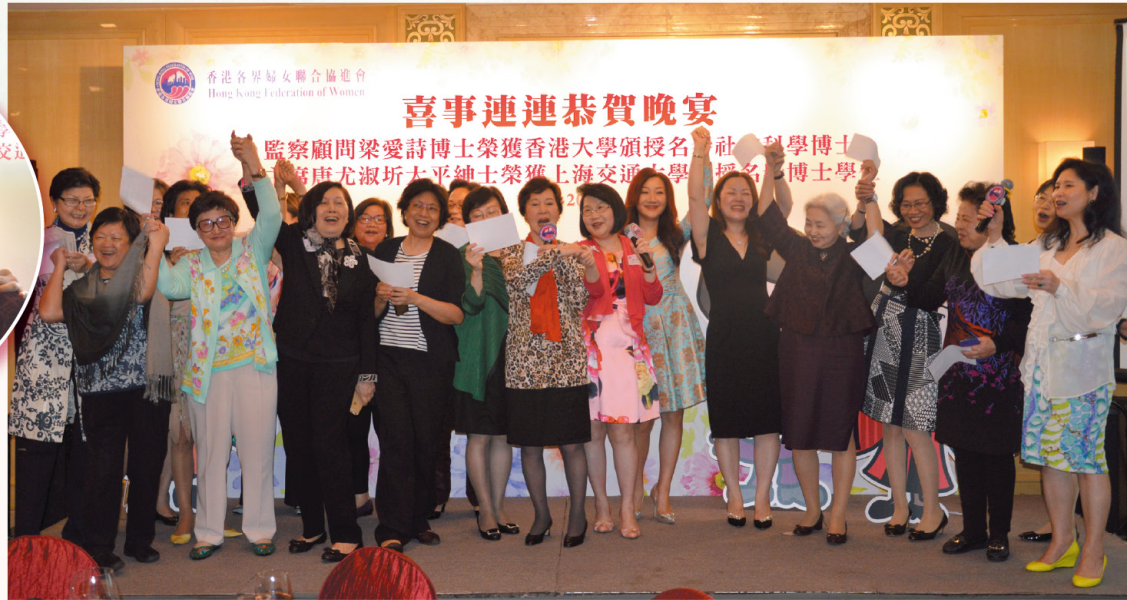
一眾會長及理事更於台上高歌「朋友」一曲， 興奮、歡樂之情盡現。 Honorary Presidents and Council Members join hands while singing the song "Friends of mine".