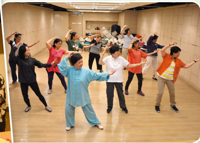
太極氣功十八式 Taichi Qigong Class