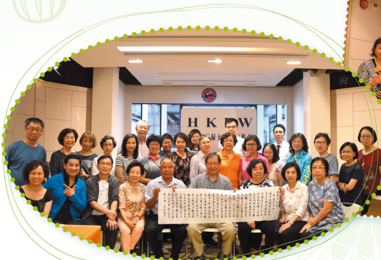
毛筆書法班 Chinese Calligraphy Class