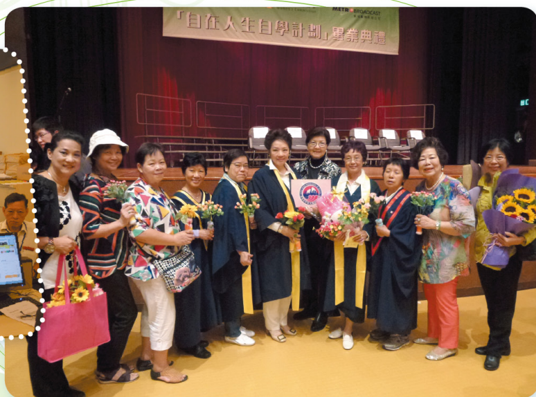
自在人生自學計劃畢業典禮 Graduation Ceremony of Capacity Building Mileage Programme