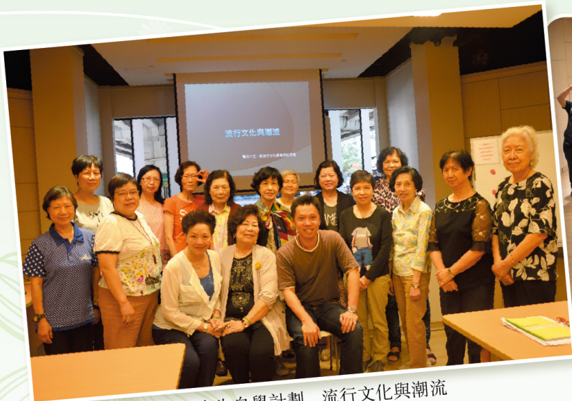
自在人生自學計劃 - 流行文化與潮流 Capacity Building Mileage Programme