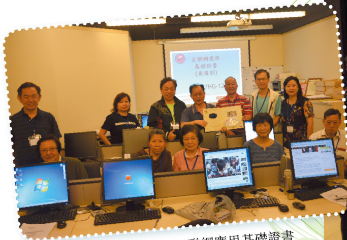
僱員再培訓局 - 互聯網應用基礎證書 Employees Retraining Board Programme