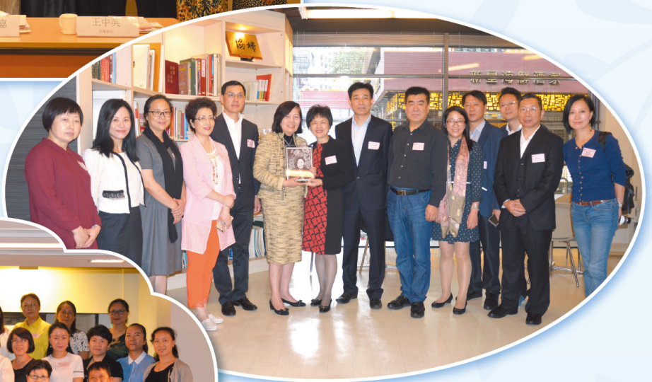
▲ 常州市委統戰部到訪 The delegation of Changzhou visit HKFW