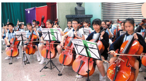
學生用心演奏，與觀眾分享學習九個月的成果。 Students perform with their hearts in their in-school finale performance.