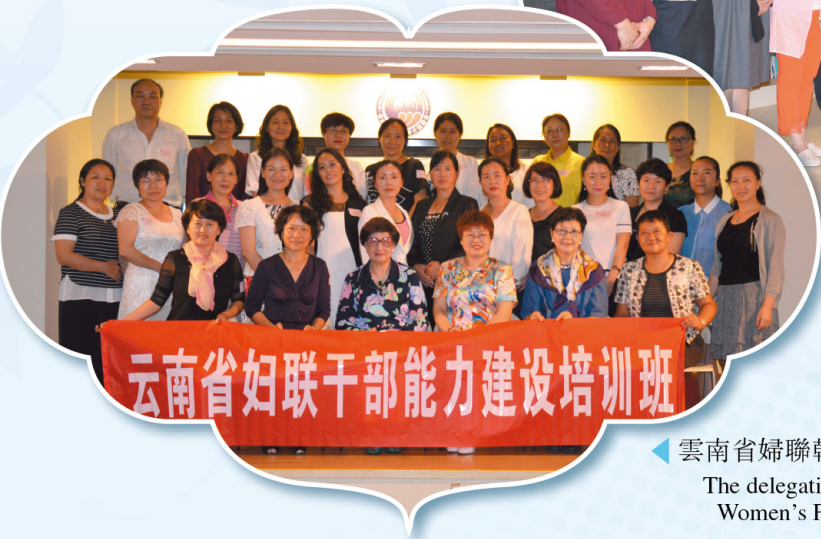
◀ 雲南省婦聯幹部能力建設培訓班到訪 The delegation of Yunnan Provincial Women's Federation visit HKFW