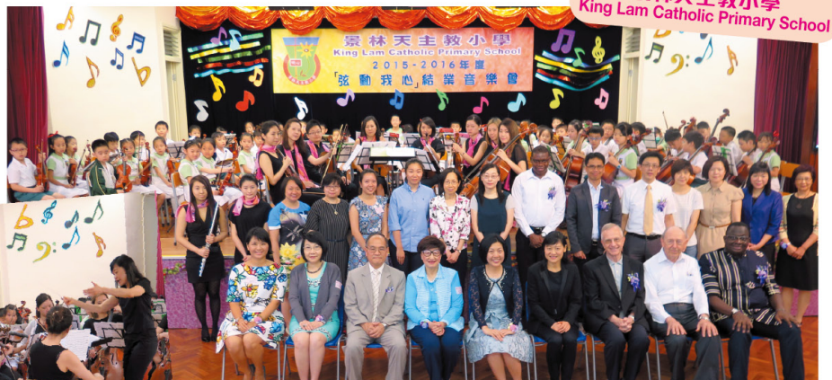
學生難得與專業管弦樂手同台演奏。 Students perform alongside with professional Orchestra musicians.