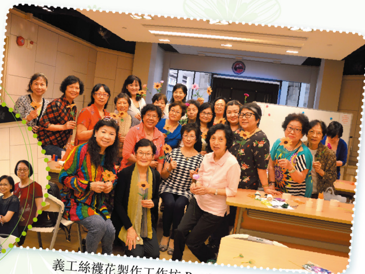
義工絲襪花製作工作坊 Ronde Flower Workshop