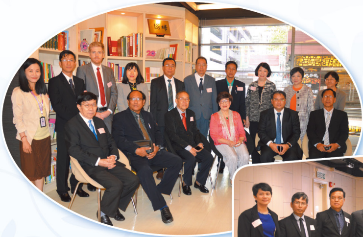
◀ 聯合國開發計劃署 (UNDP) 及緬甸國會議員到訪婦協。 The United Nations Development Programme (UNDP) and Speakers of Region and State Parliaments of Myanmar visit HKFW