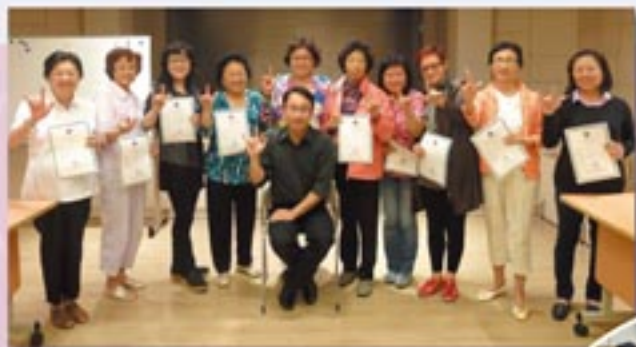
手語認識工作坊。 Sign Language Learning Workshop.