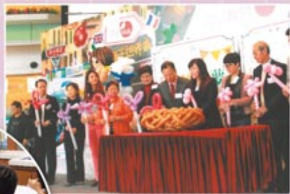
漣漪行動@深水埗。 Ripple Action @ Sham Shui Po