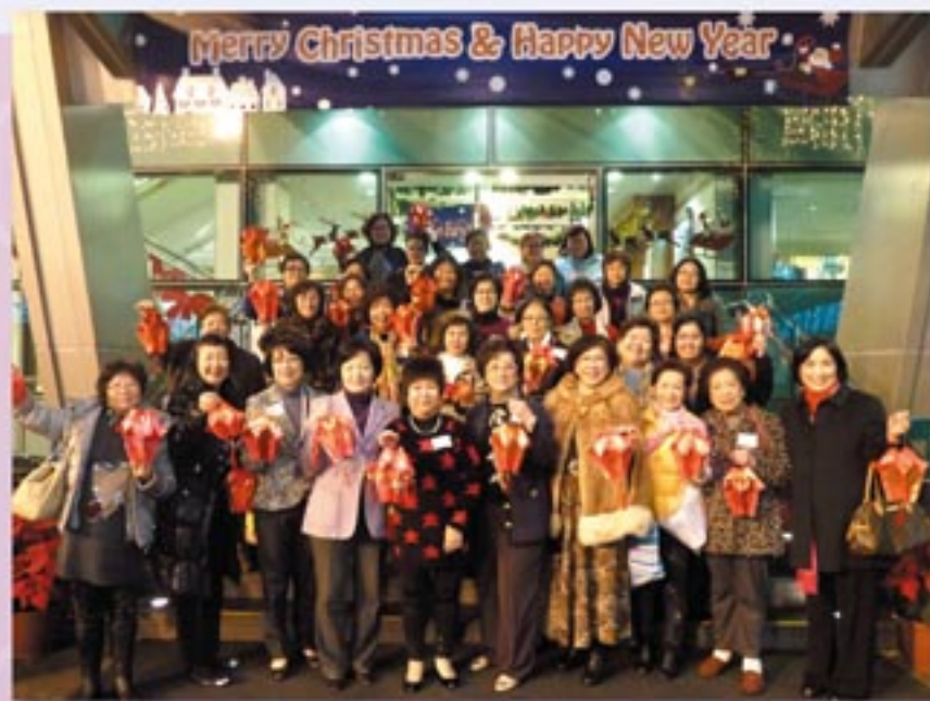
義工周年聚餐2012暨利是封宮燈製作坊。 HKFW Volunteer Annual Dinner 2012 cum Red Packet Lanterns Workshop.