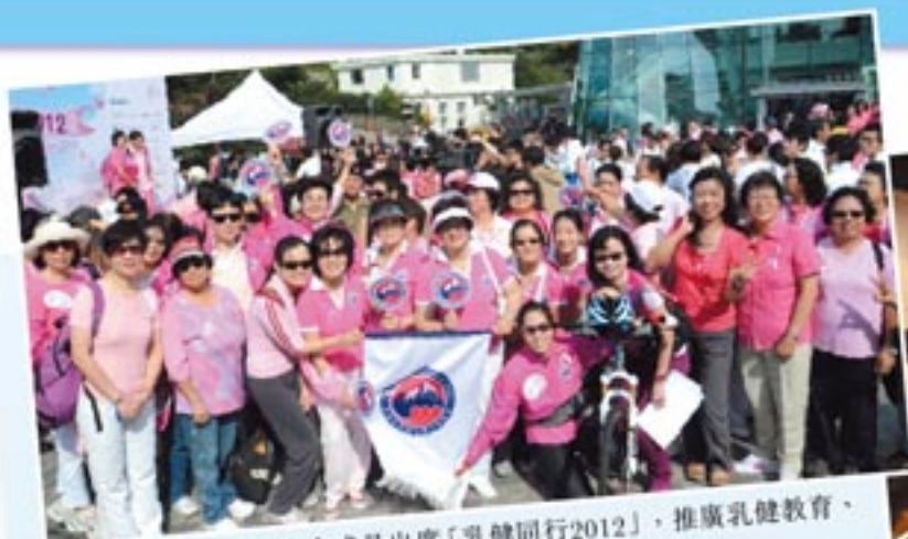
林主席率領80多位本會成員出席「乳健同行2012」，推廣乳健教育、患者支援。 80+ HKFW members joining the Pink Walk for Breast Health 2012.