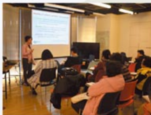
海外升學分享會。 Studying abroad sharing seminar.