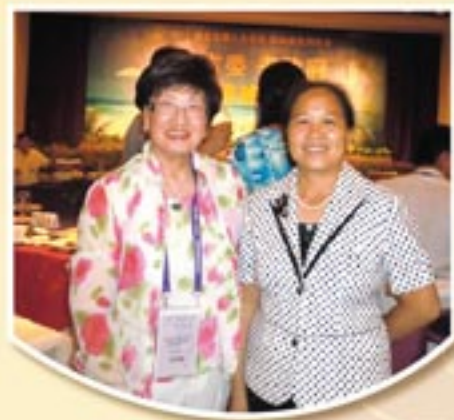
林主席在活動上喜遇海南省符躍蘭副省長。 Meeting with Fu Yuelan, Vice Governor of The People's Government of Hainan Province.