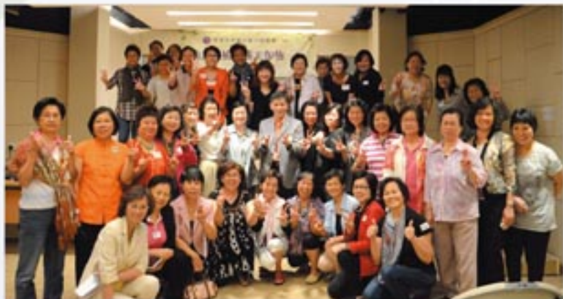
義工發展培訓工作坊6。 Volunteer Training Workshop 6.