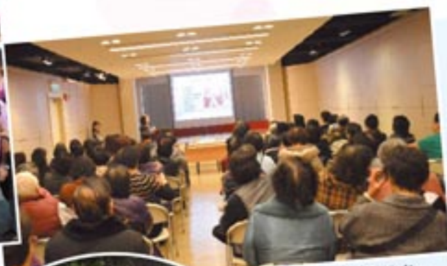
乳健教育講座。 Breast Health Talk.