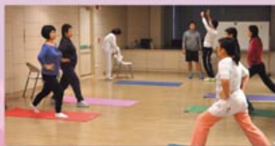
KEEP FIT 健康不求人 Keep-Fit DIY