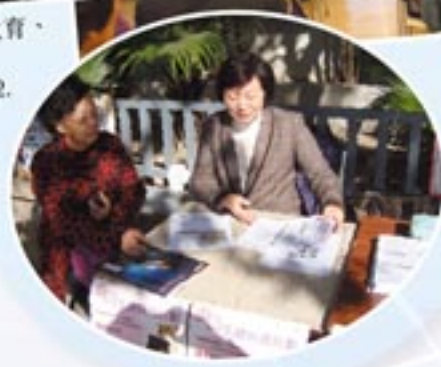
「免費婦女乳健檢查計劃」外展宣傳已於黃大仙區進行。 Breast Health Promotion held at Wong Tai Sin.