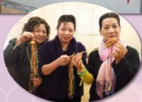
神采飛揚活力蝦製作坊。 Knots Shrimp Workshop.