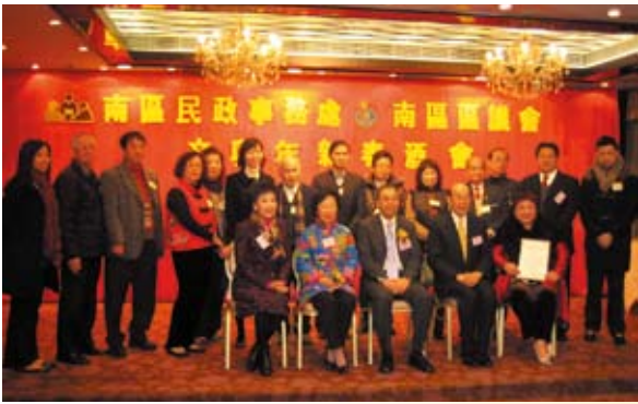
石澳婦女會 Shek O Women's Association