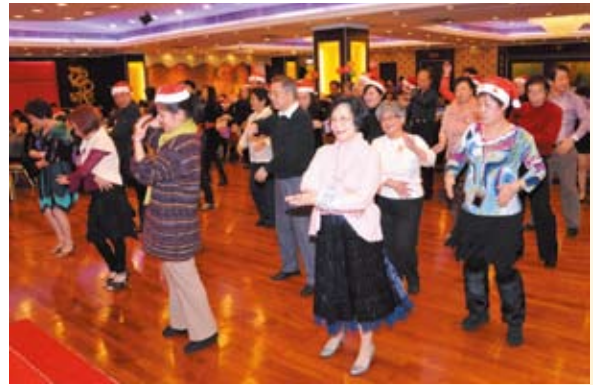
康馨婦女會 Carnation Women's Association

一年一度的『康馨聯歡迎聖誕』月前圓滿舉行，節目包括聖誕老人派禮物、幸運大抽獎、唱歌、社交舞及集體舞，整晚氣氛高漲。