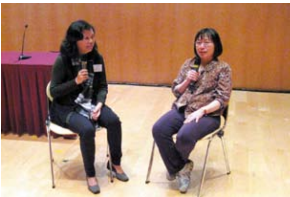
香港中文大學婦女健康促進及研究中心 Centre of Research and Promotion of Women's Health, CUHK

一年一度的『康馨聯歡迎聖誕』月前圓滿舉行，節目包括聖誕老人派禮物、幸運大抽獎、唱歌、社交舞及集體舞，整晚氣氛高漲。