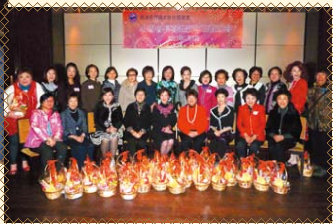
名譽會長及理事歡聚一堂。 All participants enjoyed a joyful evening.

「名譽會長委員會」聯歡晚會適逢兩屆委員會當然理事交替, 2009-10年度的當然理事王中英、蔡李惠莉及江胡葆琳, 交棒予2011-12年度的蘇陳偉香、孟顧迪安及邱吳惠平。是夜數十位名譽會長及嘉賓歡聚一堂, 加強了眾姐妹的友誼和聯繫。