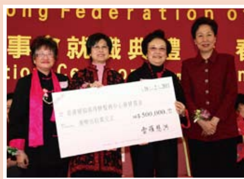
「香港婦協郭得勝服務中心發展基金」捐贈儀式：