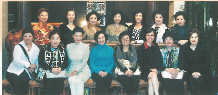
香港婦協首長於10月到海寧市參加交流活動。 HKFW visiting Haining in October.