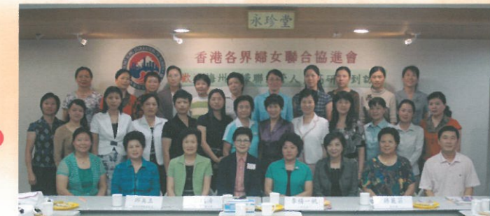
梅州市婦聯主管人員到訪。 Visit of Meizhou Women's Federation.