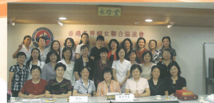
江蘇省婦聯到訪。 Visit of Jiangsu Women's Federation.