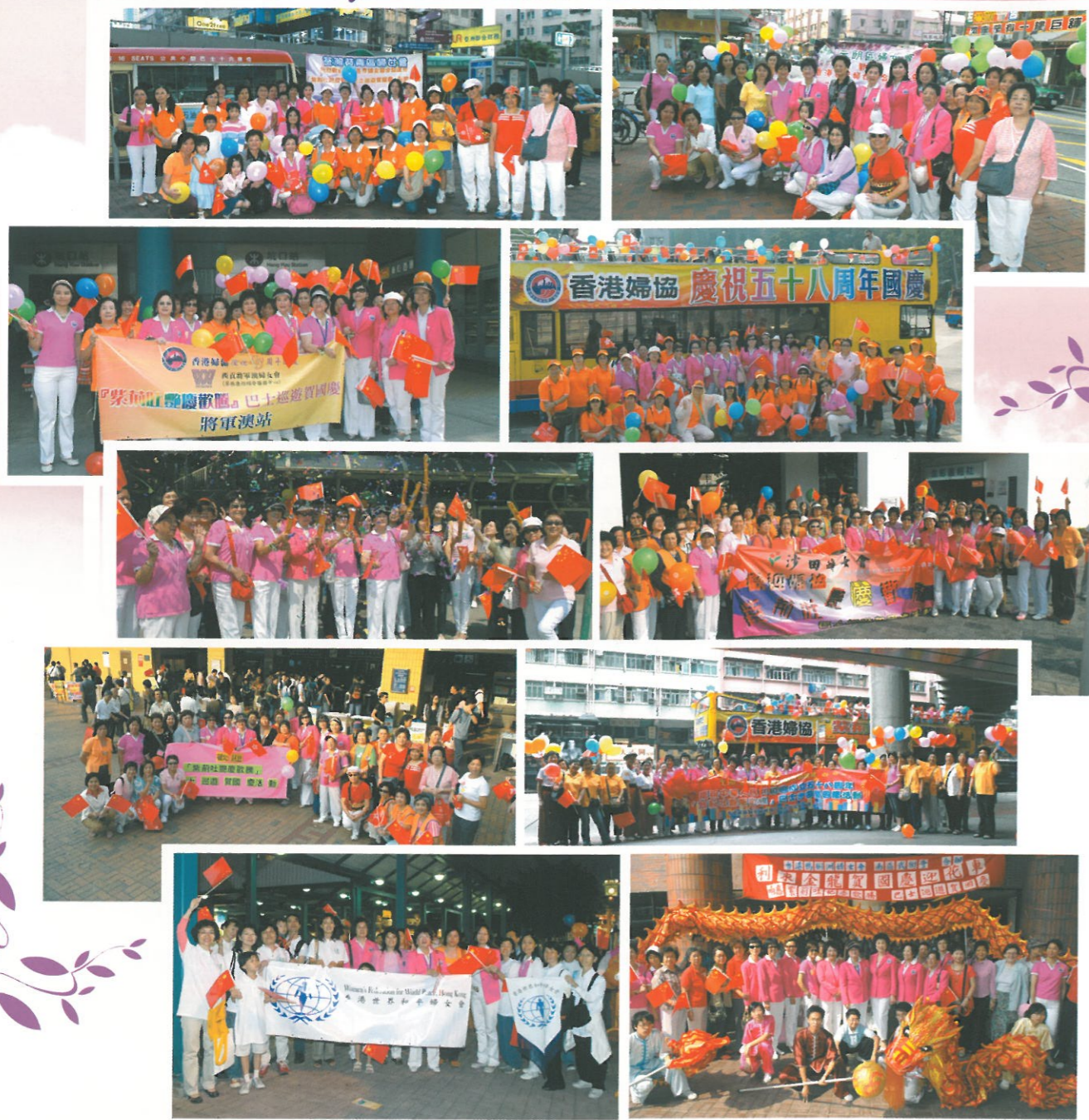
各區婦女團體及市民熱烈參與，同賀祖國華誕。