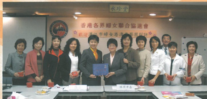
湛江市婦女港澳考察團到訪。 Visit of Zhanjiang Women's Federation.