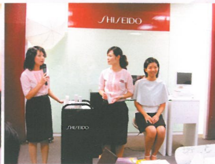
「彩妝研習班」教授學員美容、護膚及化妝的技巧。 Beauty and Make up Class.