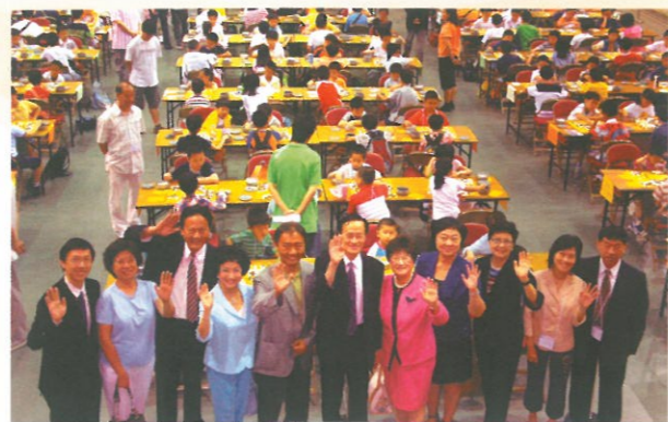
△ 各嘉賓到現場為參賽者打氣。 Guests attending the Teens GO Tournament co-organized by HKFW and Hong Kong Weiqi Association Hong Kong Development Centre.

當日約有二百名五至十六歲的青少年分八個組別作賽，家長們在場打氣，香港婦協多位理事亦出席觀賽。