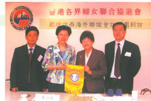
△江西海外聯誼會訪問團到訪。 Welcoming the Jiangxi visiting group.