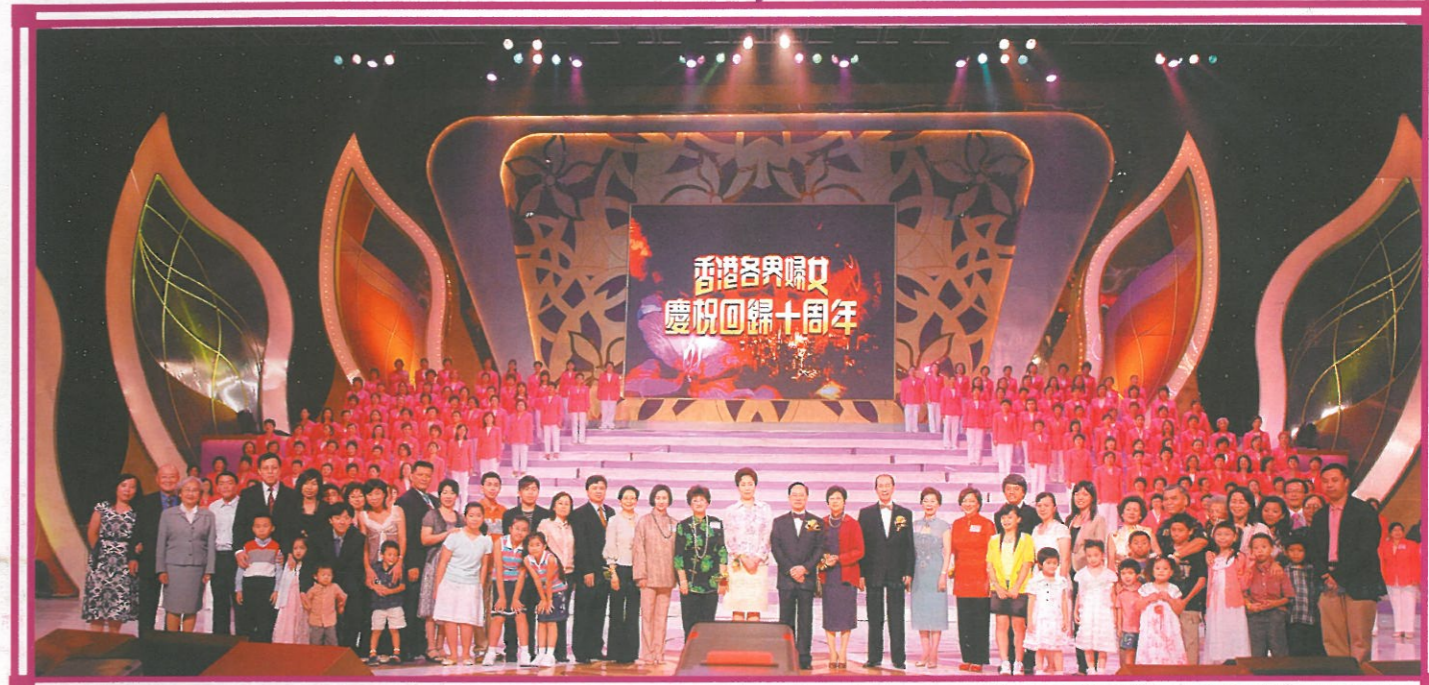
△ 主禮人與十個最具代表性和諧家庭合照。Officiating guests and the 10 most outstanding Harmonious Families.

HK Women celebrating the HKSAR 10th Anniversary Cultural Show cum "Hong Kong Harmonious Family Drive" Award Presentation Ceremony