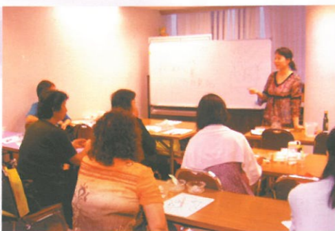
「美容DIY(四)之自製無添加潤唇膏」，示範自製天然而適合各種皮膚的橄欖油潤唇膏，並講解天然材料對皮膚的好處。 DIY Lip Balm Class.