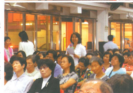
△ 各界婦女熱烈發表意見