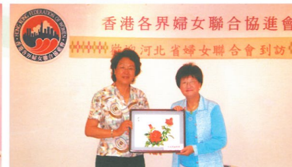
△河北省婦女聯合會到訪,雙方互贈紀念品。 Hebei Women Federation presenting a souvenir to HKFW.