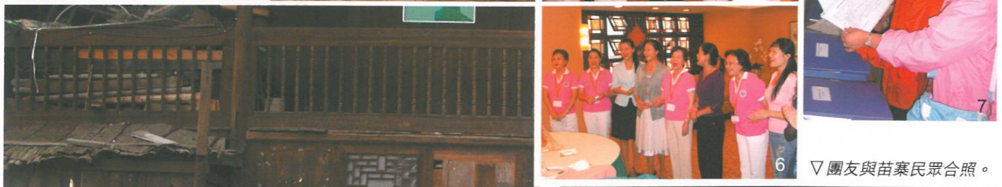
▽團友與苗寨民眾合照。