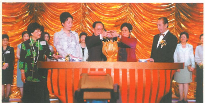
△ 曾特首伉儷主持將東方之珠放入紫荊花內的啟動儀式。 Chief Executive Mr. Donald Tsang and Mrs. Selina Tsang officiating at the ceremony.

此外，晚會並有國內享負盛名的青海歌舞劇院、中國雜技團及山西呂梁鼓樂團來港獻技，以奔放熱情的歌舞，激盪人心的鼓樂，為全場七千觀眾帶來一個難忘及精彩的晚上，更為香港回歸十周年慶祝活動增添無限色彩。