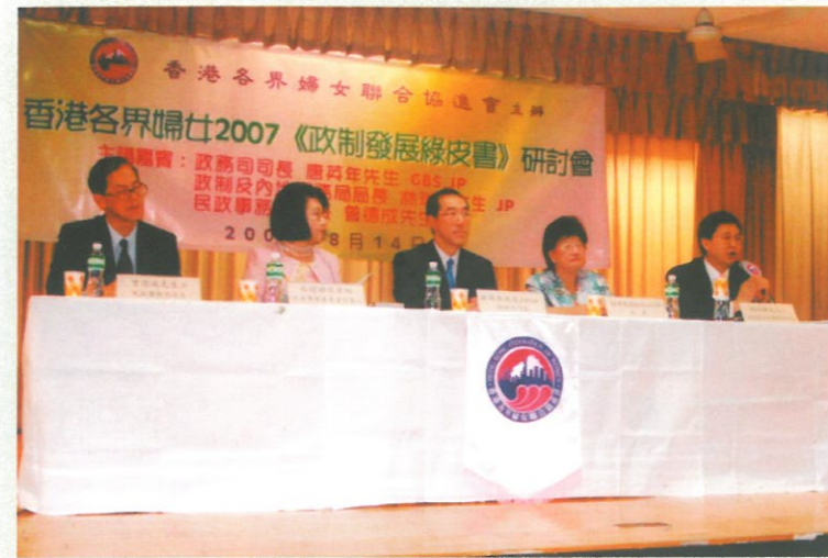
左起：曾德成局長，蔡關穎琴執委，唐英年司長，林主席，林瑞麟局長。

香港特區政府於2007年7月11日開始就《政制發展綠皮書》諮詢公眾，為期三個月，讓港人有機會在開放的平台上討論政制發展，協助政府逐步落實普選。本會特於8月14日主辦「香港各界婦女2007年《政制發展綠皮書》研討會」，邀得政務司司長唐英年先生(當天為署理行政長官)、政制及內地事務局局長林瑞麟先生及民政事務局長曾德成先生出席研討會。參加研討會的婦女團體近百個，代表三百餘人。本會綜合各界婦女的意見後，得出的主流意見如下，並已呈交特政府：