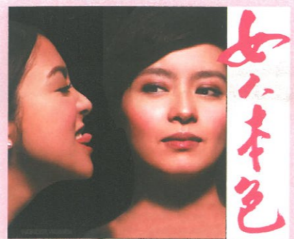
△梁詠琪和薛凱琪在「女人本色」中表現出色