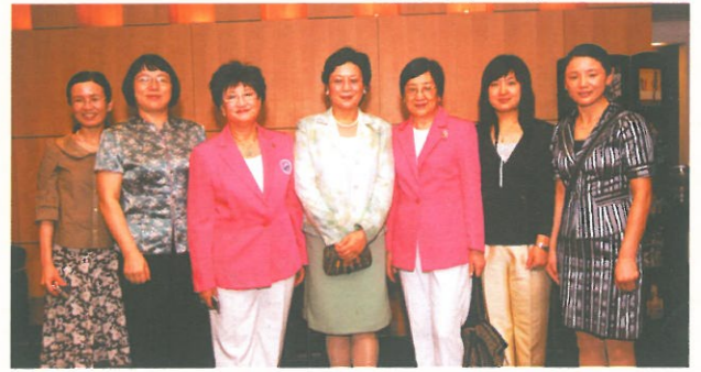
▽ 全國婦聯甄硯書記(左四)與代表團親臨致賀。 The All-China Women Federation (ACWF) delegation from Beijing.