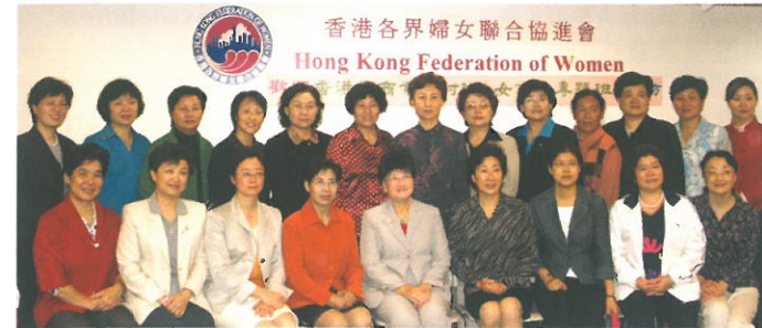
香港工商業研討班(女市長專題班)一行二十二人到訪。 Welcoming a delegation of women majors from various cities of China.