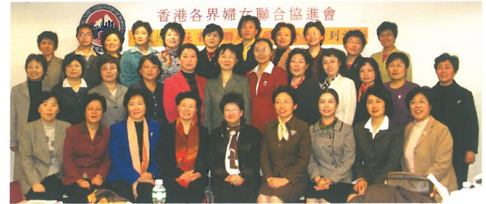
江蘇省婦聯到訪，本會特設午宴招待，雙方交流甚歡。 Welcoming Jiangsu Women's Federation.