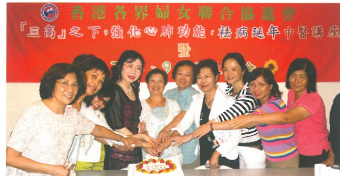
「三高之下，強化心肺功能，祛病延年中醫講座」暨「7、8、9月份生日會」，參加者對中藥治療方式大感興趣，並獲益良多。 Chinese Medicine Talk cum Jul-Sep Birthday Party.