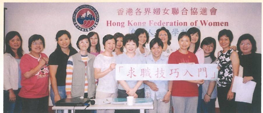
學員們在「求職技巧」課程中，透過模擬面試實習，掌握求職面試的技巧。 Participants sharpened their interviewing skills through practices.