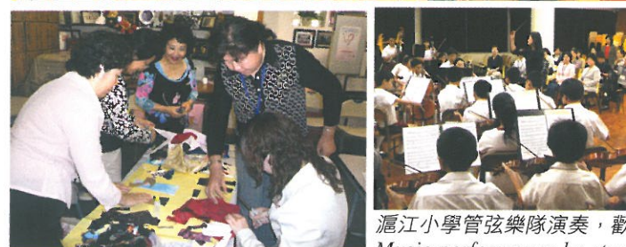
滬江小學管弦樂隊演奏，歡迎團員蒞臨。 Music performance by students of Shanghai Alumni Primary School to welcome the group.