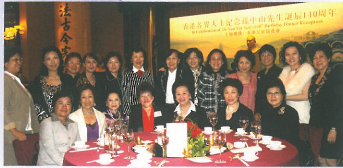
本會支持「香港各界人士紀念孫中山先生誕辰140周年」紀念晚宴及出任合辦團體，一同向國父孫中山先生致敬。 HKFW Members attending dinner reception in Celebration of Dr Sun Yat-Sen's 140th Birthday.