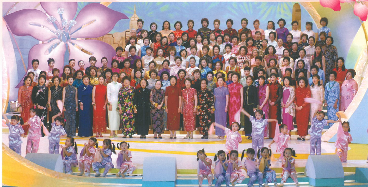
國慶晚會的特色「婦女大合唱」為大會揭開序幕。 Guests and the HKFW Choir performing at the show.

本會為慶祝中華人民共和國成立五十七周年，於九月二十八日假將軍澳電視城隆重舉行「香港婦協紫荊吐艷慶歡騰」國慶晚會，邀得香港特區行政長官夫人曾鮑笑薇、外交部駐港特派員公署特派員夫人張靜姪、中央人民政府駐港聯絡辦公室特邀顧問陳鳳英及香港基本法委員會副主任梁愛詩親臨主禮。