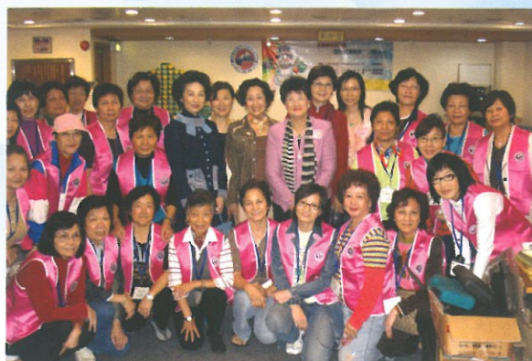
理事與落力協助義賣的一眾婦協義工合照。 HKFW Volunteers acting as salesladies.

To advocate the protection of our environment, the Recycle Charity Sale 2006 was launched in early December. Over HK$50,000 has been raised. The fund will be donated to support the HKFW Emergency Fund and the projects for environmental protection.