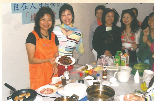
「健康飲食」課程導師示範烹調精美健康小菜。 Demonstration of cooking healthy cuisines in the 'Keep Fit Course'.