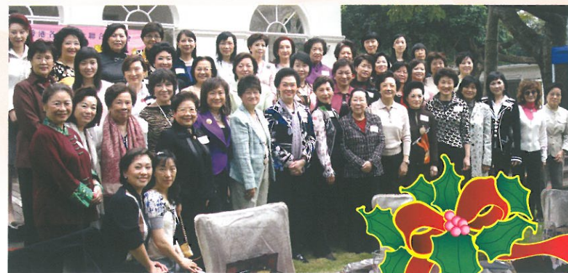
五十多位參加者在環境優美的財政司官邸花園內齊齊合照留念。

This happy gathering was organized successfully, with special arrangement to hold the function at the residence of the Financial Secretary. Delicious cuisine, lots of lucky draw prizes and a snack competition made the event most cheerful. Special thanks were given to all donors and sponsors.