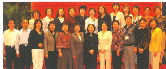
梁愛詩監察顧問(前右六)設晚宴招待。 Dinner hosted by Supervising Advisor Elsie Leung (front row, 6th from right).