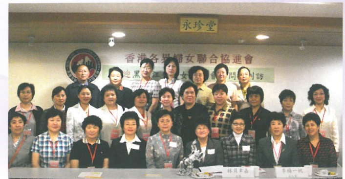
黑龍江婦聯致送駿馬紀念品予本會。 Heilongjiang Women's Federation presenting the souvenir to HKFW.