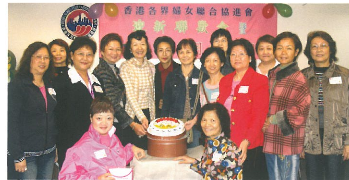
「迎新聯歡會暨10、11、12月份生日會」歡迎新會員加入婦協，同場加設「男士湯水篇」中醫講座。 New Members Welcoming Party cum Oct-Dec Birthday Party.