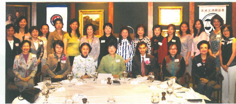
是次午餐講座，出席者踴躍提問交流，氣氛熱烈。 Participants actively involved in the talk.

In the light of increasing public awareness on privacy, HKFW and Hong Kong Women Lawyers Federation organized a lunch talk in October. We were honored to have invited Dr. Elsie Leung and Prof. Albert Chen as our guest speakers. The participants enjoyed the inspirational talk which was followed by heated discussion.