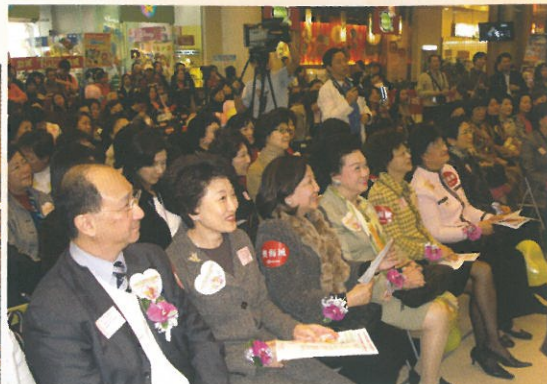
出席嘉賓、各界婦女團體及傳媒陣容鼎盛。 Guests, participating women organizations and media.