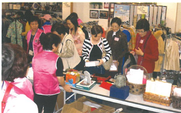
顧客們細心選購，滿載而歸。 Customers choosing their favorites.