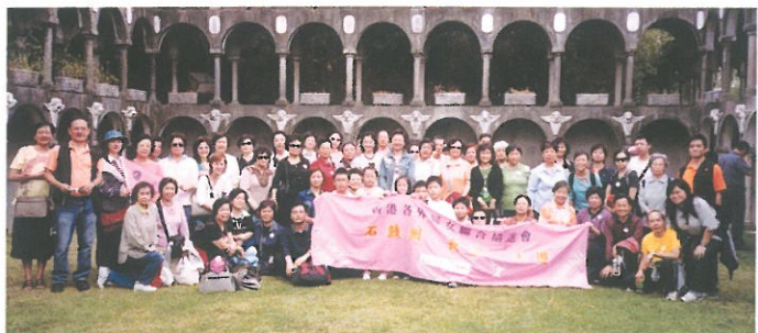
「石鼓洲、長洲一天遊」參加者探索被列為禁區的石鼓洲；並暢遊長洲。 1-Day Tour to Shek Kau Chau and Cheung Chau.