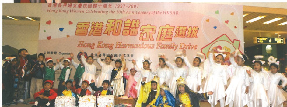
維多利亞(何文田)幼稚園的學生載歌載舞，為大會揭開序幕。 Students from Victoria (Ho Man Tin) International Nursery performing to commence the event.