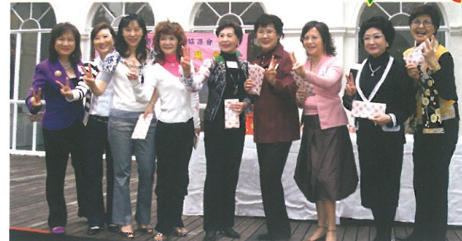
下午茶點心比賽參加者齊齊獲得紀念品，皆大歡喜。 'Winners' of the snack competition.