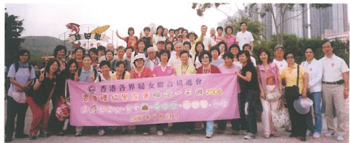
「香港婦協學友會聯誼一天遊2006」安排參加者到綠田園、荳品廠、醬園等地參觀，各人飽嚙海鮮宴。 "HKFW Alumni" 1-Day Tour.