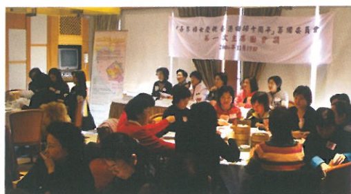
第一次主席團會議在選拔活動啟動禮舉行前召開。 The first meeting of the Organizing Committee.