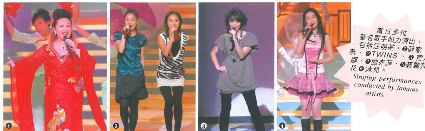
當日多位著名歌手傾力演出，包括汪明荃、薛家燕、TWINS、官恩娜、劉亦菲、蔣麗萍及泳兒。 Singing performances conducted by famous artists.