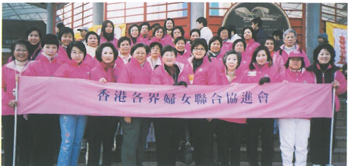
本會捐出十萬元並派出兩支隊伍參與公眾金百萬行。 The HKFW donated HK$100,000 to support the Community Chest "Walk for Millions".