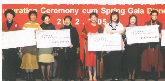
各副主席代表婦協致送支票予成功獲得資助的各個婦協團體會員。 Cheque presentation to Corporate Members who were successful applicants in receiving funds of the HKFW Subsidizing Scheme.