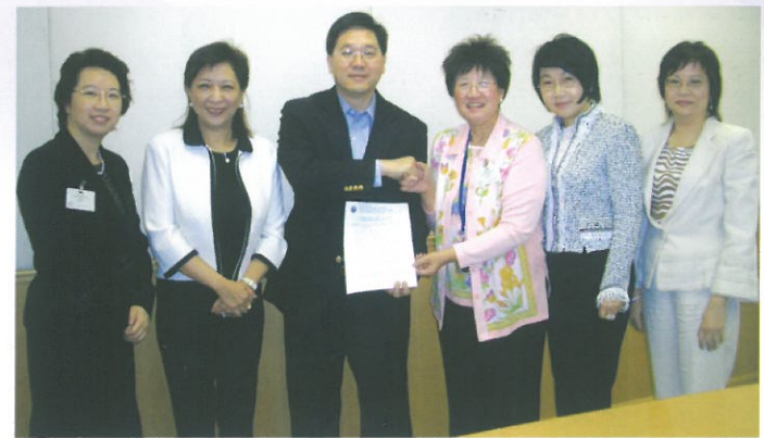
婦協向「政制發展專責小組」成員政制事務局長林瑞麟呈交意見書。 Submitting the HKFW Position Paper on the 4th Report of the Constitution Development Task Force to The Hon. Stephen Lam, Secretary for Constitutional Affairs.

本會不贊成將委員人數一下子增至數千、數萬人等等，因這有違《基本法》循序漸進的原則。