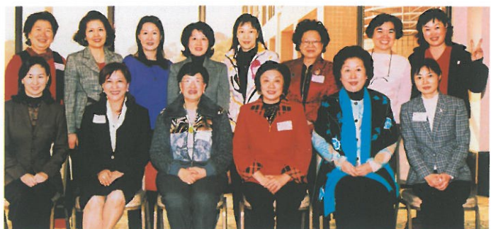
女企業家會拜訪深圳女企業家協會午餐共聚，加強交流。 Lunch discussion between HKFW Entrepreneurs Committee and female entrepreneurs from Shenzhen.