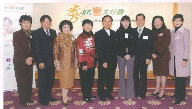
「秀得有營大行動」新聞發佈會中，多位專家出席分享。A photo taken at the press conference.

The Healthy Eating Pyramid from Harvard School of Public Health.