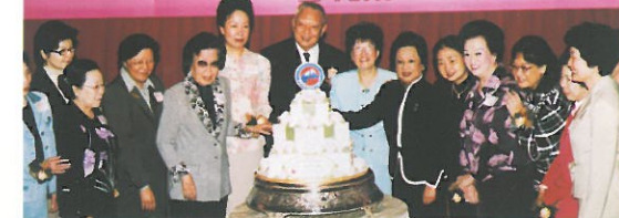
精美大蛋糕賀董建華先生步步高昇。 Congratulations to Mr. Tung on his election.