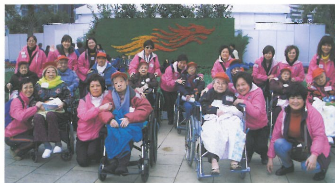
十多位熱心婦協義工陪同播道醫院的長者參觀花卉展覽。HKFW volunteers accompanying the elderly to a flower show.

Thank you dinner for volunteers who gave support to the HKFW activities.