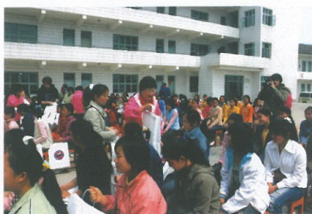
各團員親自致送文具包予全體學生。 Stationery gift packs given to the students.