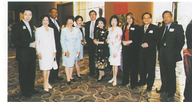
多國領事及夫人親臨致賀，婦協理事代表歡迎。 Welcoming the Consulate Generals and their wives of various countries.