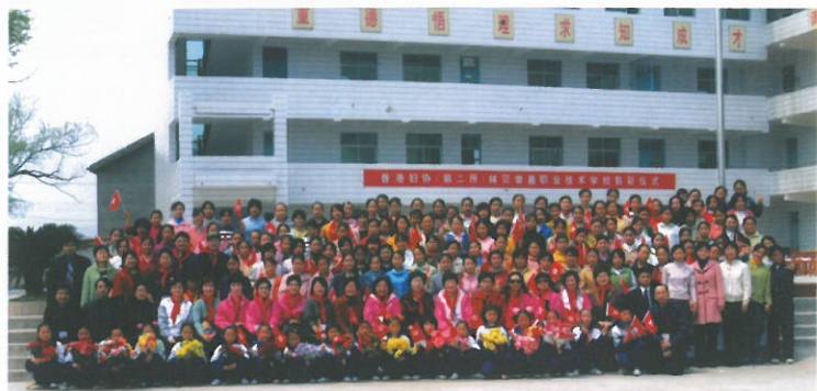
中學揭幕禮完成後，各嘉賓與全校師生合照。 A memorial group photo.