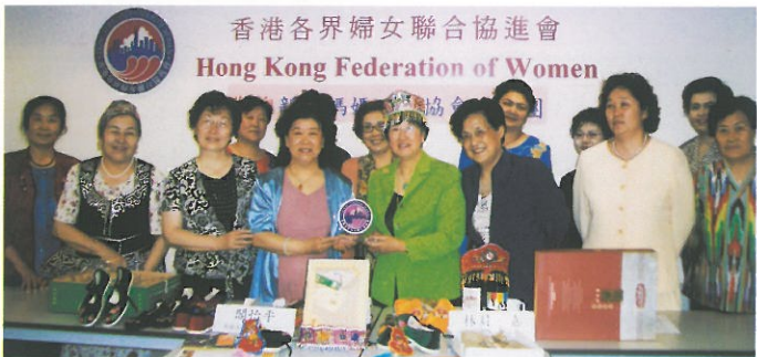
新疆媽媽互助協會到訪。 Exchanging souvenirs with the "Xinjiang Mother's Mutual Aid Association".