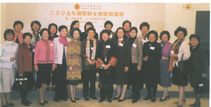
應邀出席婦委會慶祝「三八」酒會。 Attending the "International Women's Day" Celebration hosted by the Women's Commission.