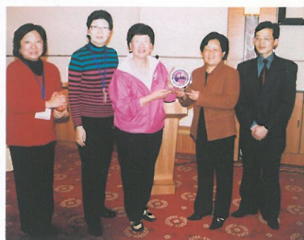
致送紀念品予張家界市政府及婦聯主席。 Presenting souvenir to local officials.