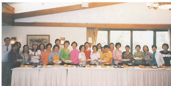
「雙魚河歡樂派對」參加者展示在大廚指導下，烹調美味的露筍鵝肝。