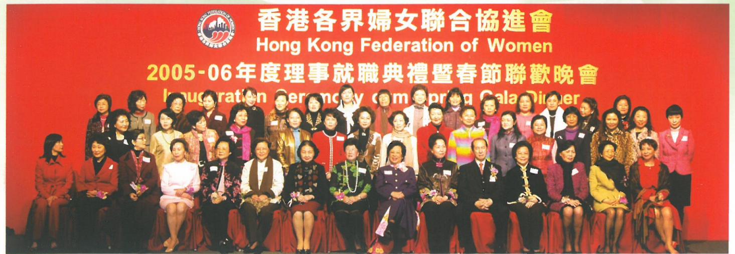
主禮嘉賓與2005/06理事合照 Officiating Guests and the newly elected Council Members.

晚會於二月廿六日假九龍灣國際展貿中心完滿舉行，主禮嘉賓包括前行政長官夫人董趙洪媽、中聯辦副主任郭莉、律政司司長梁愛詩、立法會主席范徐麗泰及晚宴贊助人何鴻榮博士；並由黃汝璞及余詩思任聯席召集人。