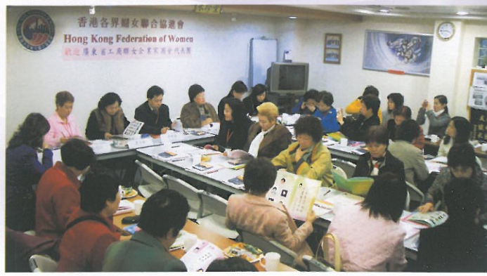
廣東省工商聯女企業家近四十人到訪與婦協交流。 A visit by the female entrepreneurs from Guangdong General Chamber of Commerce.