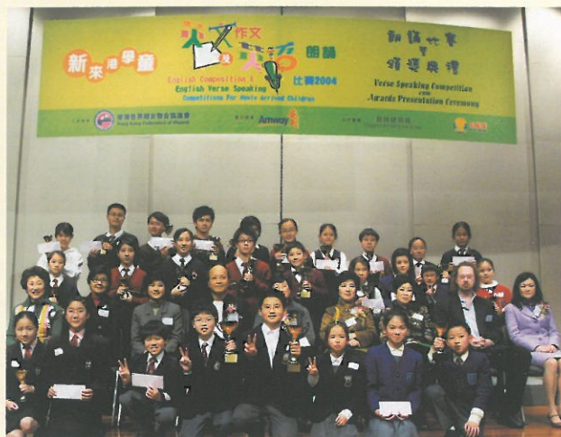
各組得獎者心情興奮，手持獎杯及書券與嘉賓們合照留念。

The competition was another year of success and the prize presentation ceremony was held in January at the Hong Kong Convention and Exhibition Centre. We wish to express our deepest gratitude to the sponsor Amway(China) Co. Ltd., the Education and Manpower Bureau, the Sun, the judges and all participating schools, teachers and students. This year, special awards were presented to teachers of the winners as recognition of their efforts.