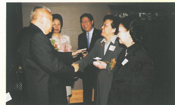
右起梁愛詩司長，范徐麗泰立法會主席，馬時亨局長及中聯辦郭莉副主任向董先生致賀。 SAR Officials greeting Mr. Tung at the reception.