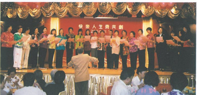
婦協合唱團應亞洲婦女會邀請，出席長者活動並獻唱。 HKFW Choir invited by Asia Women's League to perform at the elderly event.