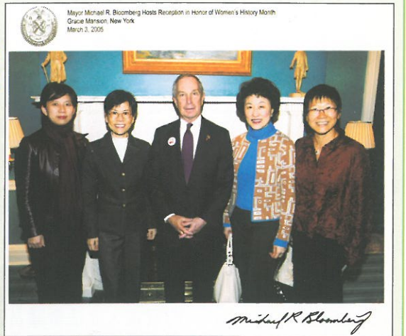
出席慶三八酒會與紐約市市長 Mayor Michael Bloomberg(中)合攝。 Meeting Mayor Michael Bloomberg of New York City at the International Women's Day Cocktail.