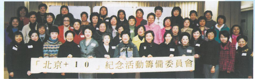
「北京+10」紀念活動，籌委會在第一次會議後合照留念。 The “Beijing + 10” Working Committee Members.

今年是北京舉辦第四屆世界婦女大會的十周年，香港婦協應全國婦聯呼籲，已發起並聯同七十多個婦女團體合力籌辦「北京+10」香港紀念活動，四個大型項目現已陸續舉辦及進行，分別為：