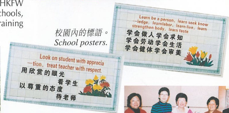
校園內的標語。 School posters.