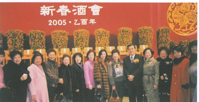
中聯辦新春酒會中與外交部駐港特派員楊文昌(右五)合照。 Attending the Lunar New Year cocktail reception by the Liaison Office of the Central People's Government in HKSAR.