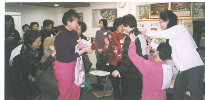
自在人生自學計劃之「領導與合作技巧」課程，以生動的形式授課，大受婦女歡迎。

The opening ceremony of the "Women's Health Month 2005."