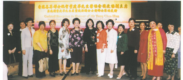
婦女界領導雲集，向董建華伉儷致敬。 Women leaders attending to pay salutations to Mr. and Mrs. Tung.