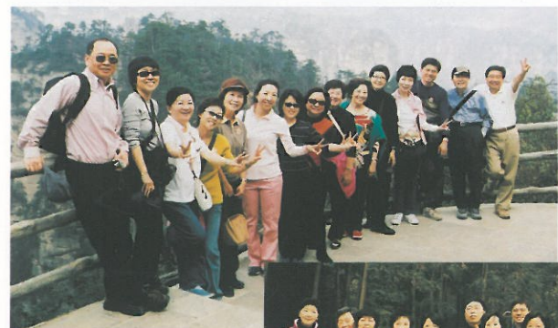
團員飽覽張家界名山秀水風光。 Delegates enjoying the beautiful scenery of Zhang Jiajie.