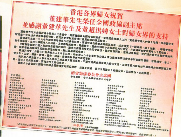
香港婦協及婦女團體代表分別在三月十四、十五及四月二十二日在各大報章刊登致謝賀稿，在鑲裱後致送予董建華伉儷。 Congratulating and thank you messages on the newspapers by HKFW and various women organisations were framed and presented to Mr. & Mrs. Tung.