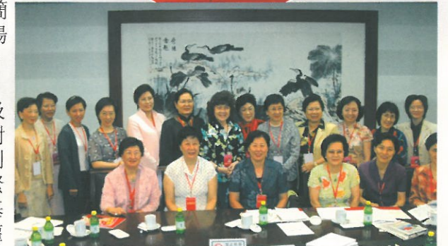
香港特邀代表在大會中與各省市婦女交流。