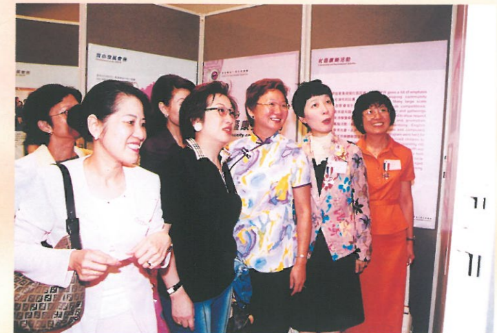
喜見婦協十年來會務蒸蒸日上，精彩的活動照片令理事及會員們看得眉飛色舞。 Council Members were delighted to see the photos of the past events.