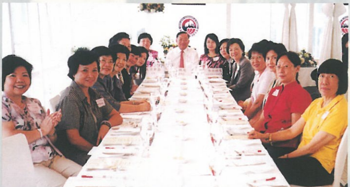
社會事務委員會邀得李鵬飛太平紳士出任主講嘉賓，主講財政預算案與香港的關係與管治。 Mr. Allen Lee, JP was invited as guest speaker at the lunch meeting.