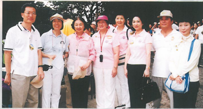
本會理事出席環境保護運動委員會舉辦「齊踏步環保路 共創健康香港」步行活動。 The Council Members attended "Walking for a Green and Healthy Hong Kong" organized by the Environmental Campaign Committee.