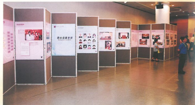
展板共一百塊，詳盡展出婦協十年來的工作及成果。 A total of 100 exhibition boards were presented.