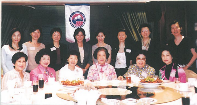
名譽會長委員會舉行第一次晚宴，聯誼歡聚。 Honorary Presidents' dinner meeting.