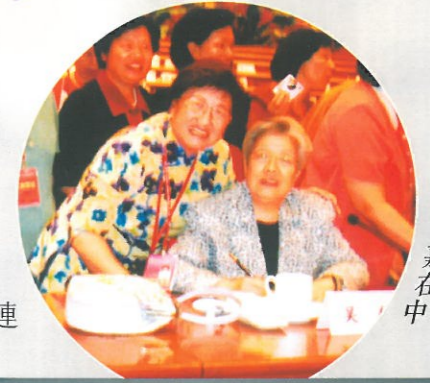
吳儀副總理與林貝聿嘉主席在閉幕禮中合照。

透過領導人的講話、全國婦聯的工作報告、各地婦女代表的小組分享，各香港特邀代表表示深受感動及鼓舞，對未來的婦女工作更添信心，亦希望借鏡內地的經驗，鼓勵香港婦女終身學習、提升自己，在香港經濟轉型的情況下，把握時機，尋找新突破，正如顧秀蓮主席提出的「創造新崗位、創造新業績及創造新生活」，她並要求各特邀代表將大會訊息廣為傳達，這亦是分享會的主要目的。