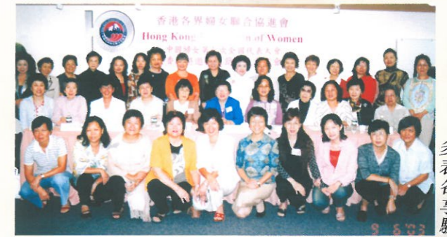
多位特邀代表返港後與各界婦女分享大會經驗。