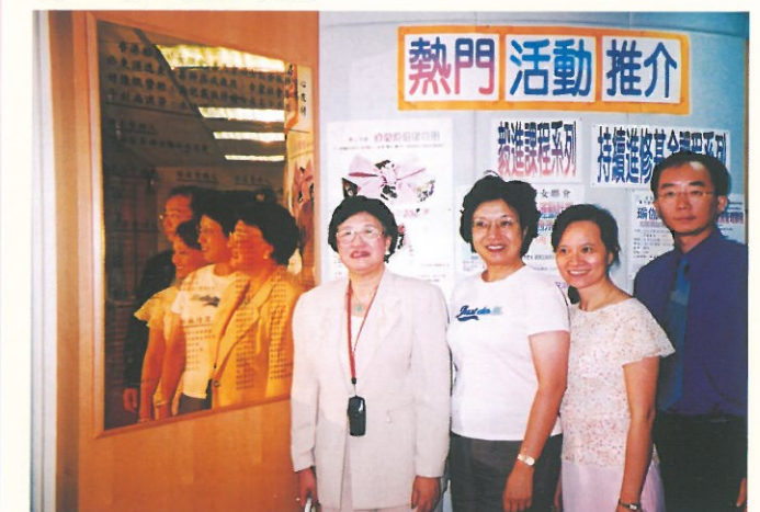
本會以「鑽石贊助」的名義捐出港幣50,000元予「香港離島婦女聯會賽馬會綜合服務中心」作籌辦經費，婦協的會名刻於該中心特製的牌匾上，永誌留念。