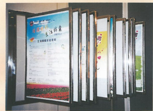
陳列架上展出婦協十年來各項活動的海報。 A showcase that exhibited the posters of past events.