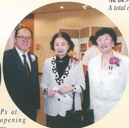
VIPs at the opening ceremony.