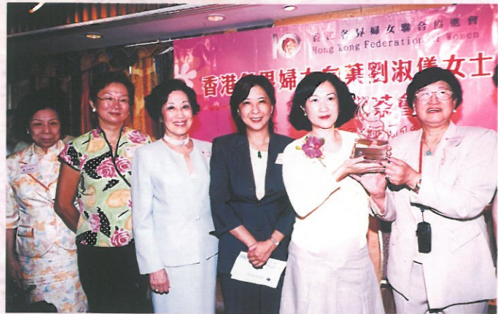
本會致送刻有「一片冰心 愛國愛港」的水晶紀念座予葉太。