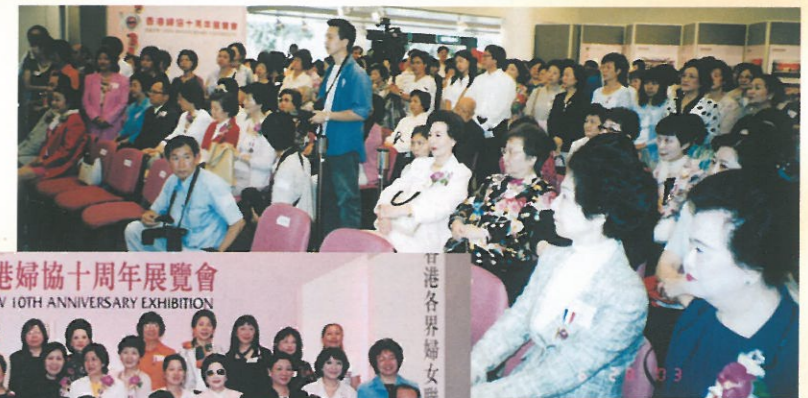
出席及採訪者眾達五百人 Nearly 500 people attended the opening ceremony