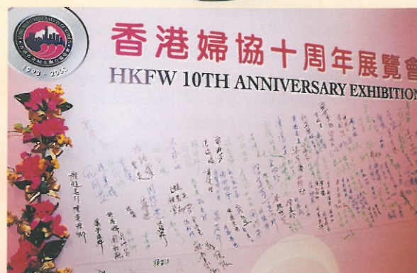
眾來賓於題名板上簽名留念。 The guests signing board.