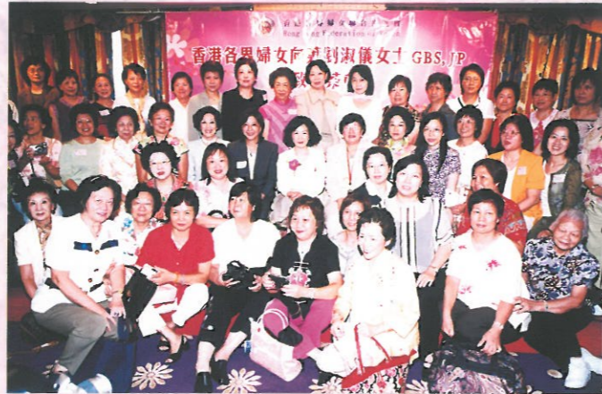
葉太與本會理事、會員、團體會員及各界婦女合照。