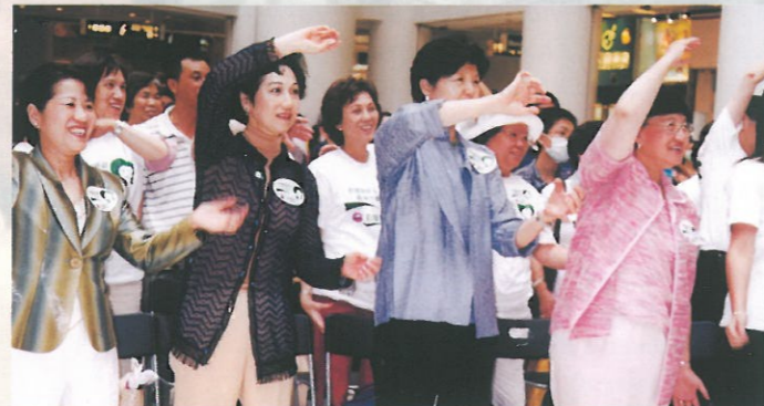
本會與白蘭氏機構合辦「紓壓顯新姿體驗計劃」，讓各參加者在世界婦女健康日中分享減壓的樂趣。 "Women's Stress-relief Campaign".