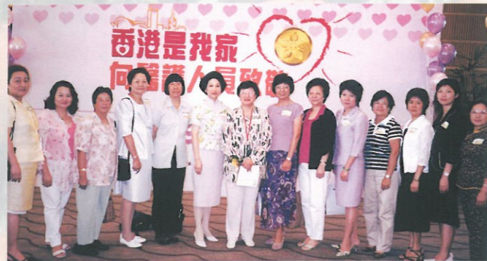
「香港是我家——向醫護人員致敬」大會於七月初舉行，向本港所有奮力抵抗「非典型肺炎」的前線醫護人員致敬，婦協為籌辦機構之一，並發動各團體會員一同支持。 Participating "Hong Kong Our Home - Salutation to Health Workers Ceremony".