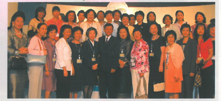
泰國副總理H.E. Purachai Piumsomboon (前左七) 出席大會與眾來自中國的代表合照。

APEC WLN Meeting was held successfully from 30 July to Aug 3, 2003 in Chiangmai, Thailand. The theme chosen for this year, "Women Make a World of Difference: Partnership for Gender and Development" aims to stress the importance of women's contributions to a better world. It also emphasizes the central role of partnership on its multiple forms that will engender and enable gender equality and a balanced, equal, and sustainable development.