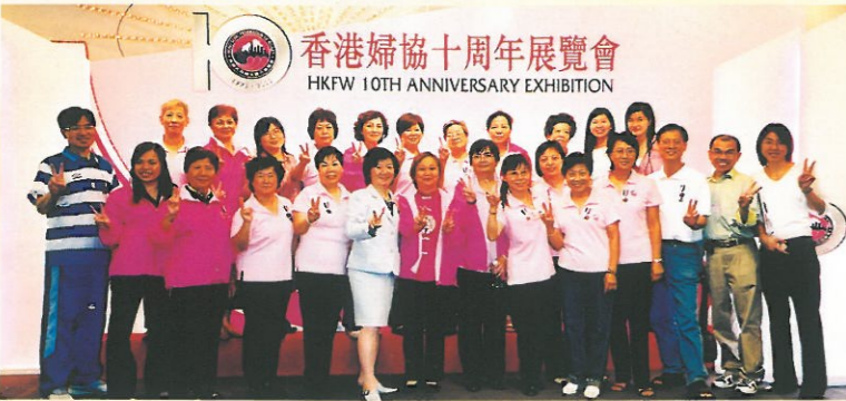
展覽會的義工合照留念，眾人都經常熱心支持婦協的活動。 A group photo of the enthusiastic voluntary workers.