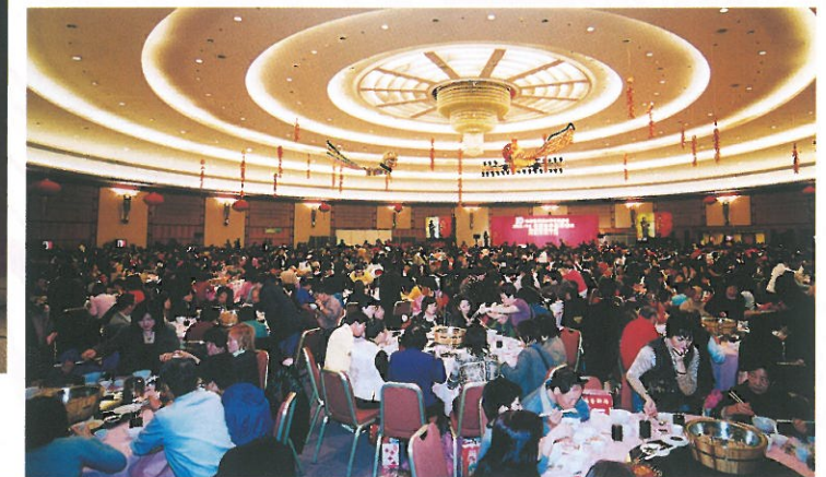
晚會筵開一百二十席，眾來賓品嘗盆菜。 120 tables of guests enjoying the traditional "Pun Choi".