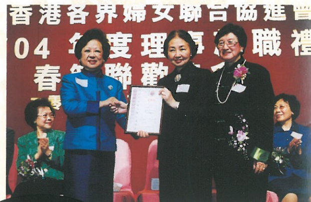
行政長官夫人董趙洪娉女士致送「監察顧問」委任狀予梁愛詩司長(中)。 Mrs. Betty Tung presenting the Supervising Adviser certificate to Ms. Elsie Leung(middle).