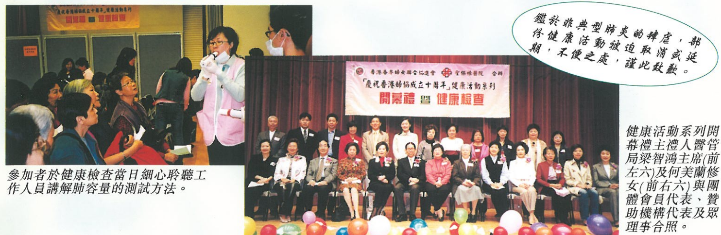
參加者於健康檢查當日細心聆聽工作人員講解肺容量的測試方法。

We would like to express our gratitude to the doctors, speakers, sponsors and volunteers.