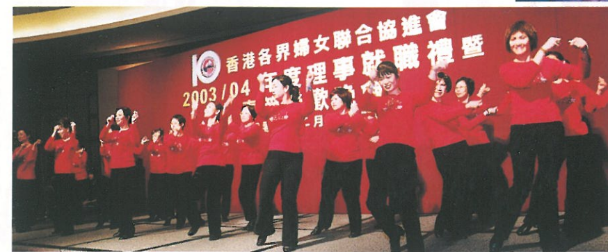
舞蹈班成員的演出充滿活力。 Performance by HKFW dancing group.