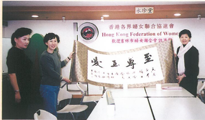
吉林市婦女聯合會到訪時送上書法題字予本會留念。 Women's Federation of Jilin City visiting HKFW.