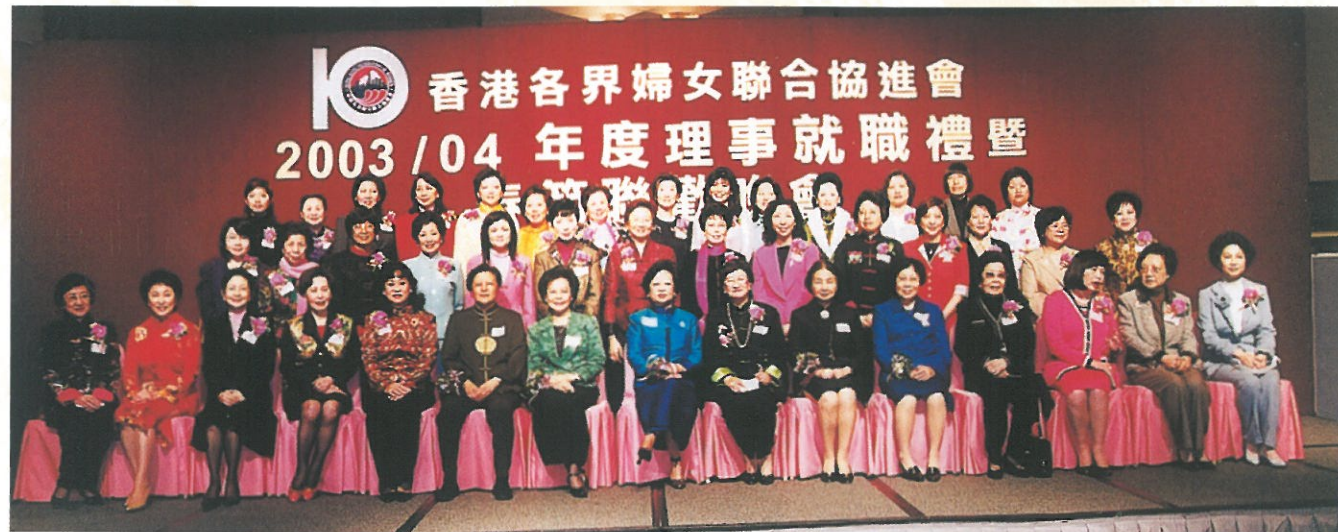
主禮嘉賓與2003/04年度理事合照。 Guests of Honour and the new Council Members of HKFW.

「2003/04年度理事就職典禮暨春節聯歡晚會」已於二月假九龍灣國際展貿中心舉行，邀得行政長官夫人董趙洪娉、律政司司長梁愛詩、外交部駐港特派員夫人鄭淑芳、中聯辦副主任陳鳳英及立法會主席范徐麗泰為晚會主禮嘉賓，到賀嘉賓及婦協會員達一千四百多人，場面熱鬧。