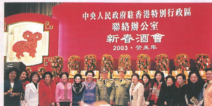
本會理事及名譽會長等應邀出席中聯辦的新春酒會。Council Members attending New Year Cocktail Reception organised by the Liaison Office of Central People's Government in the HKSAR.