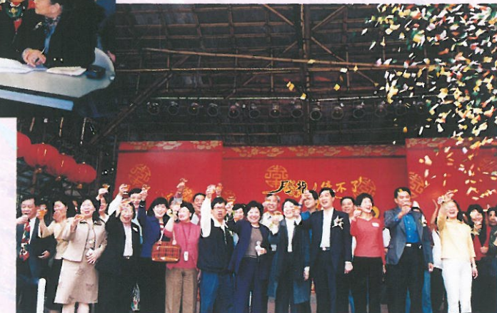
由本會與其他團體協辦以幫助失業人士的「黃大仙騰龍墟」，已於三月初完滿結束，眾在閉幕禮時齊祝酒慶祝。A closing ceremony that marked the end of "Wong Tai Sin Dragon Market".