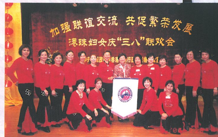
本會三月應邀到珠海出席「港珠婦女慶三八聯歡會」，舞蹈班成員並為大會演出。HKFW delegates attending International Women's Day Celebration in Zhu Hai.