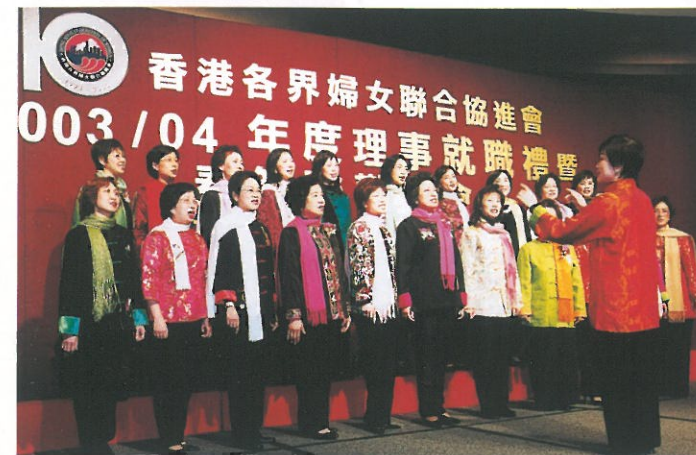
婦協合唱團演唱賀年歌曲「恭喜您」及「迎春花」。 Performance by HKFW Choir.