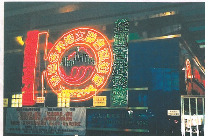
為慶祝十周年而特別設計的會徽，製作成耀眼的燈飾掛於香港婦協如心服務中心的外牆上。Specially designed lighting to celebrate the 10th Anniversary of HKFW at the Nina Kung Service Centre.