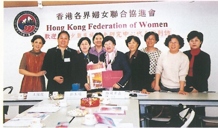
「少數民族婦女研究中心」代表團月前到訪。 The Centre of Chinese Ethnic Women Studies in the Central University for Nationalities' delegation visiting HKFW.