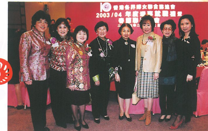
理事們與各位來賓相見歡。 Council Members welcoming the guests.