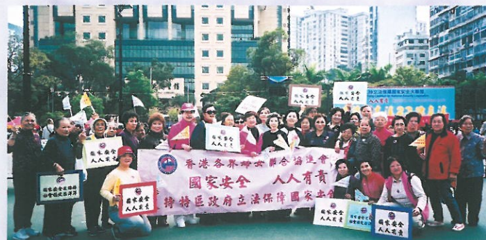
本會發動各團體會員參加在維園舉行的「支持立法大集會」。 HKFW Members participating in the gathering of H.K. Coalition for National Security Legislation at Victoria Park.