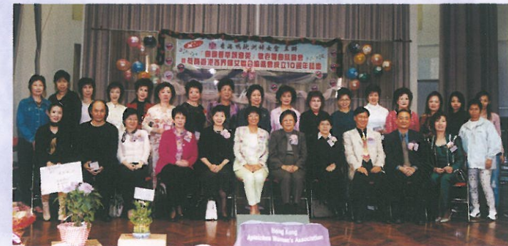
香港鴨洲婦女會主辦「曲韻萃英頌耆英」敬老粵曲欣賞會暨恭賀香港各界婦女聯合協進會成立10週年誌慶。 Hong Kong Apleichau Women's Assoc. celebrated the 10th Anniversary of HKFW.