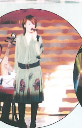
容祖兒獻唱。 Singing performance by Joey Yung.