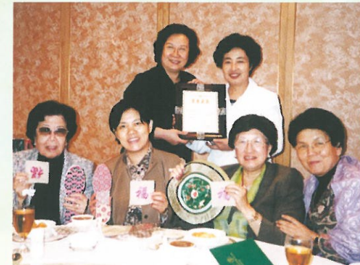
本會去年捐贈港幣五十萬元，助內蒙古五個貧困地區家庭建造水窖，解決缺水之困。中國婦女發展基金會莫文秀副會長(左二)帶來感謝狀及內蒙古婦女親手製造的紀念品，以表對婦協捐款人的感激。 Receiving souvenirs of appreciation from Inner Mongolia families.