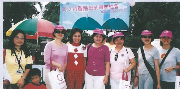
十多位義工參加香港母乳育嬰協會舉行的「山頂步行籌款」。 HKFW Volunteer supported the Fund Raising Walkathon of Hong Kong Breastfeeding Mother's Association.