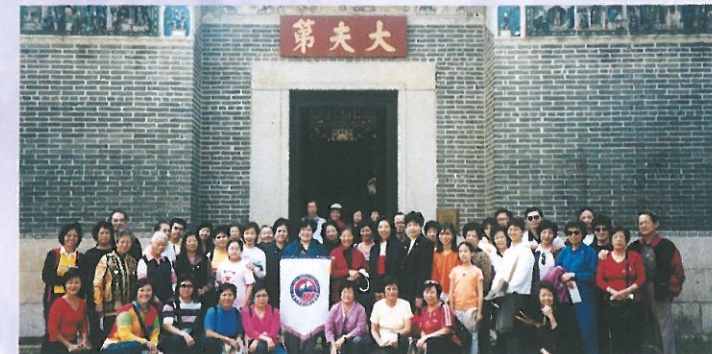
會員及親友齊齊參加「盤菜一天遊」並於大夫第門前留影。 Members joined a tour and enjoyed traditional "Pun Choi".