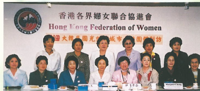
韓國光州 廣域市婦女訪問團一行十多人到訪。 Welcoming the Delegation from Korea.