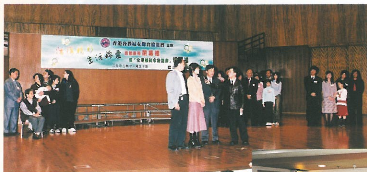
獲獎家庭齊齊上台與觀眾見面，大會於當日即場宣佈冠、亞、季軍以及優異獎家庭，氣氛既緊張又溫馨。 Winning families on stage.

「全港模範家庭選舉」入選家庭與評判見面，包括首席評判社會福利署署長林鄭月娥太平紳士、林貝聿嘉主席、盧高靜芝、麥樂嫻及召集人何淑賢。 The panel of judges interviewing the families.