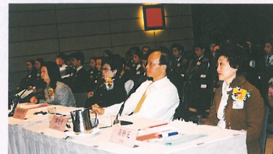
評判團全神貫注，細心欣賞及評分。 Panel of adjudicators paying much attention to judge.