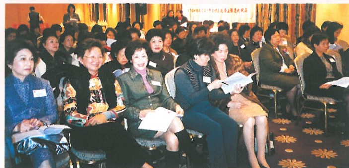
會員閱讀會務報告。 Members reading the AGM report.