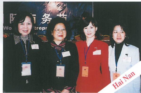
由副召集人何超瓊(左二)領隊，去年十一月往海南島海口市出席「首屆創業女性國際商務節」，並與各女企業家進行親切交流，參與商務考察活動。海南島婦聯及海口市政府等設宴歡迎。