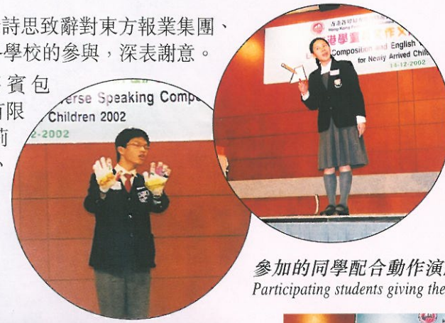
參加的同學配合動作演繹，非常投入。 Participating students giving their best performance.