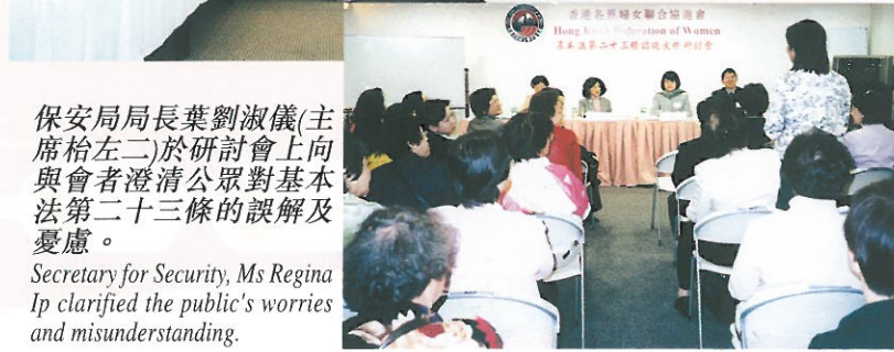
保安局局長葉劉淑儀(主席拾左二)於研討會上向與會者澄清公眾對基本法第二十三條的誤解及憂慮。 Secretary for Security, Ms Regina Ip clarified the public's worries and misunderstanding.