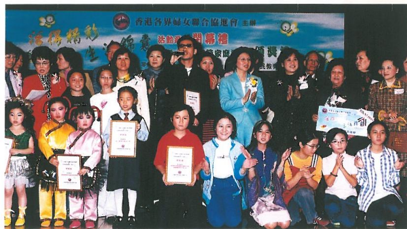
主禮人、嘉賓、籌委成員與獲獎家庭及表演嘉賓合照。 Group photo of guests, winners and performers.