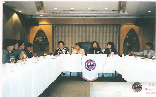
律政司司長梁愛詩(主席拾右二)於午餐會上解釋基本法第二十三條立法的背景和實施的必要。 Secretary for Justice, Ms Elsie Leung explained the Article 23 of the Basic Law at the lunch meeting.

同時，本會與其他二十六個社團組成「支持立法保障國家安全大聯盟」，安排記者會，印發單張，刊登報章聲明及參加去年十二月在維園舉行的「支持立法大集會」，以「國家安全、人人有責」為口號，支持特區政府盡快實施基本法第二十三條。