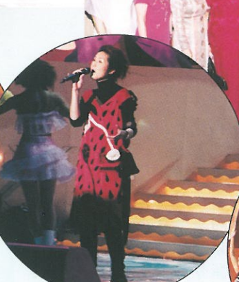
楊千嬅高歌。 Singing performance by Miriam Yeung.