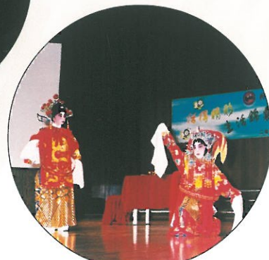
由少年學員演出的「帝女花」粵劇折子戲。 Chinese Opera Performance