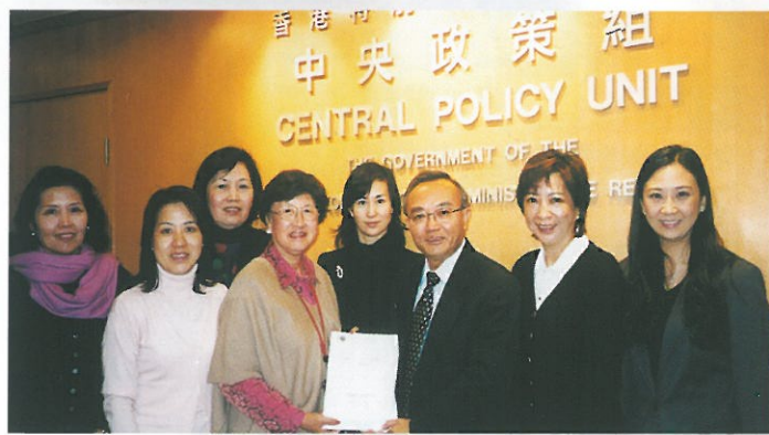
女企業家會就行政長官施政報告撰寫了「改善公共財政及經濟狀況建議書」(內容可瀏覽婦協網頁)，就開源、節流及經濟發展，向特區政府提出一系列建議；並已於去年十二月約見了中央政策組首席顧問劉兆佳(右三)，向其呈遞建議書，雙方在會中更就多個經濟角度交流意見。 Submitting our Position Paper on improving the public finance and economic condition to the Central Policy Unit.