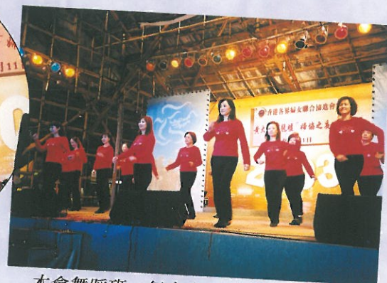
本會舞蹈班一行十多人演出「排排舞」。 HKFW's Dancing Group.