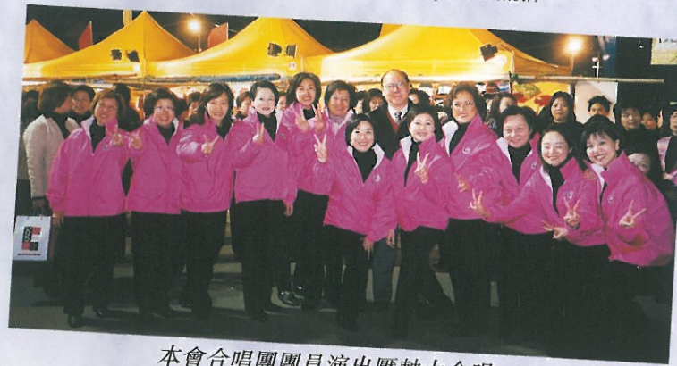
本會合唱團團員演出壓軸大合唱。 HKFW Choir sang two songs.