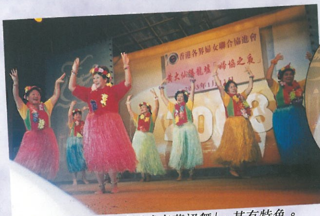
芷蘭舞蹈組的「夏威夷草裙舞」，甚有特色。 Beautiful Hawaiian dancing performance.