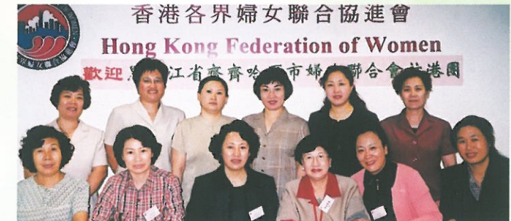
林主席與黑龍江齊齊哈爾市婦聯合照留念。 Delegation from Hei Lung Jiang.