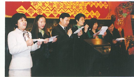
學員在歡送晚宴中以多種不同語言演唱，表達對婦協的感謝。 Trainees singing a song to show their appreciation.