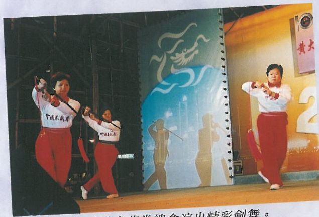
中國香港木蘭拳總會演出精彩劍舞。 Traditional Chinese Sword performance.