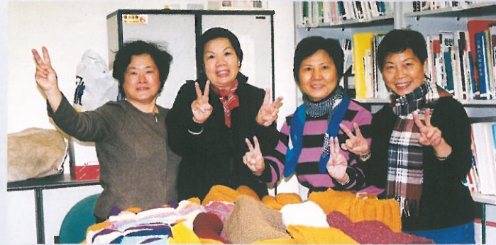
熱心的義工響應社會福利署的「傳心傳義之千里溫情(冷)線牽」活動，共織了250條冷頸巾致送長者。 HKFW donated 250 scarves knitted by the members for the elderly.