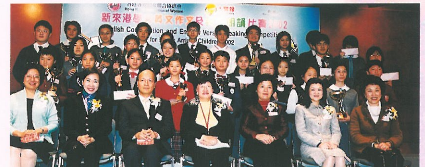
得獎的同學們手持獎盃及書券，齊齊與主禮人及評判團合照留念。 Our Guests of Honor, Adjudicators and the winners.

作文比賽的題目現場派發，同學們盡顯實力。 The English Composition Competition.