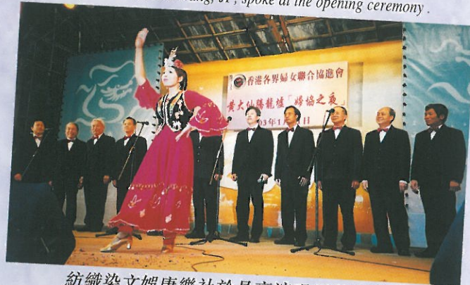
紡織染文娛康樂社於是夜演唱兩首民歌。 Singing performance by men's choir.