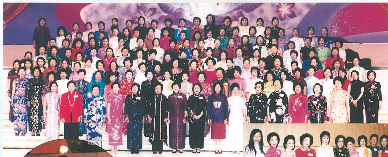
嘉賓及婦協會員大合唱同頌國慶。 Chorus to celebrate the National Day.