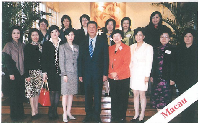
去年十月赴澳門考察商機，參觀了多個最新旅遊景點及設施，並獲何厚鏞特首親自接見；考察團從而了解澳門特區今後的發展方向：以博彩娛樂為龍頭，以旅遊服務為主體等等。