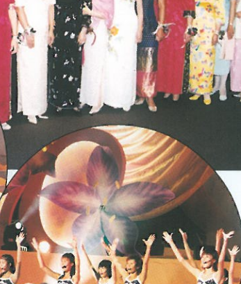
Cookies 載歌載舞。 Singing performance by Cookies.