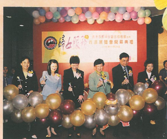
展覽會的開幕儀式簡單而隆重。