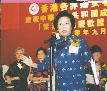
董夫人演講以「香港是我家」為題，呼籲大家「手牽手，團結就是力量」，同心合力建設香港。