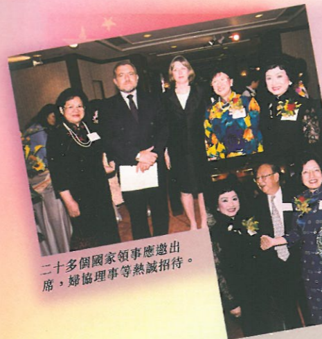
二十多個國家領事應邀出席，婦協理事等熱誠招待。