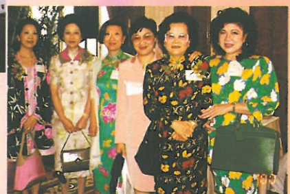
婦協成員齊來慶祝祖國五十一歲壽辰。