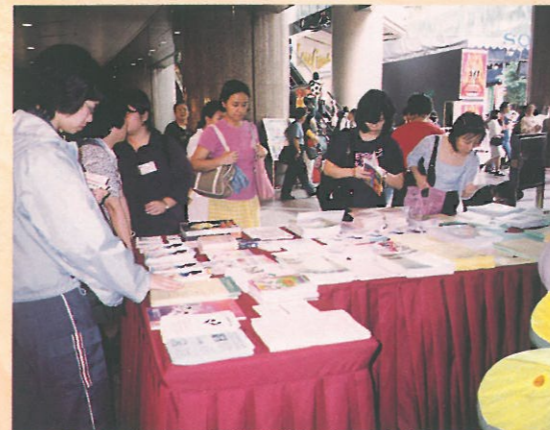
「資料閣」放置了各參展機構的訊息，參觀者正細心選取適合自己的服務資料。