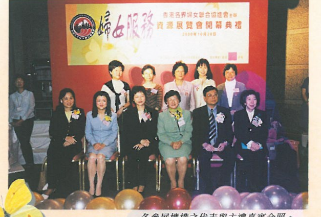
各參展機構之代表與主禮嘉賓合照。