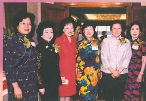
婦協主席及理事一同迎接行政會議成員王葛鳴(左三)及立法會主席范麗泰(右二)。