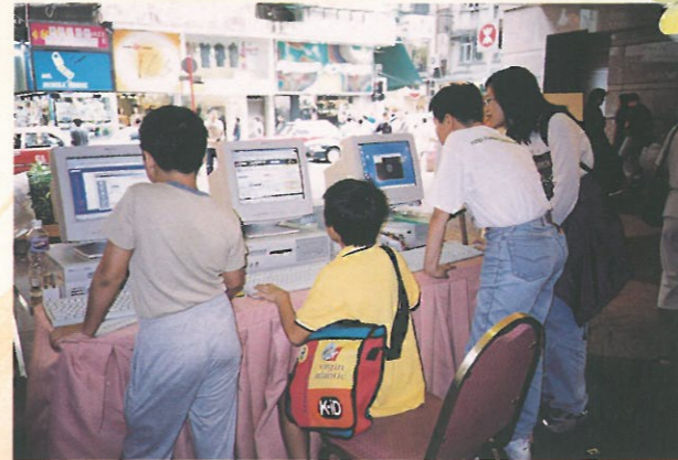
「網樂遊」——圖中的女士和小孩正嘗試上網之樂趣。