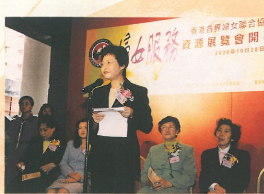
林鄭月娥署長在致辭時稱讚婦協對社會的貢獻。