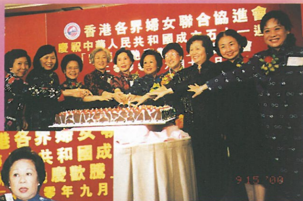
酒會召集人和贊助人陪同主禮嘉賓主持切餅儀式。