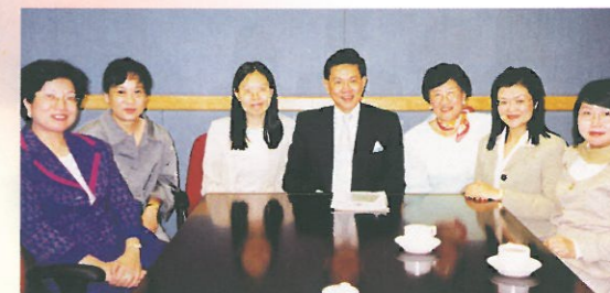
林主席與多位婦協執委於八月八日約見了衛生福利局楊永強局長(正中)及曾鳳儀首席助理局長(左三)，表達了婦協對「婦女事務委員會」的意見。