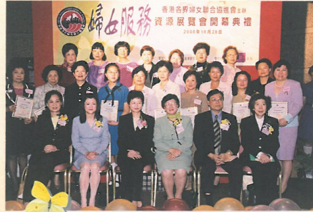
參展婦協團體會員代表與主禮嘉賓合照。