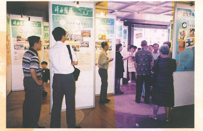
精美的展板除了吸引女士圍觀之外，亦有不少男士到場了解婦女服務。