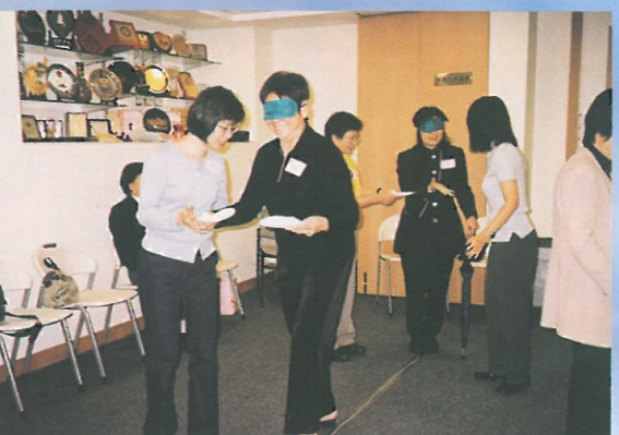
配合適當的遊戲原來是可以達致良好「減壓——身心合一」的效果。