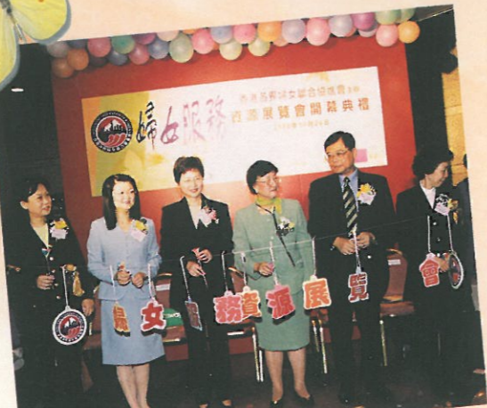
原來在七彩繽紛的汽球串中內有乾坤！