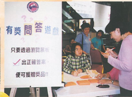
當日攤位之一「有獎問答遊戲」。