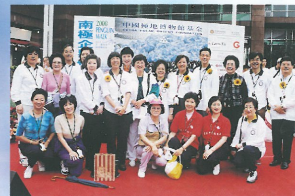
為推廣極地與環保之重要性，中國極地博物館基金會特別於十月二十二日舉行「南極企鵝伴我行」籌款活動，多位婦協成員亦有出席支持。