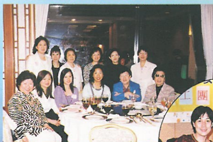
義工團聯誼聚會已於十一月十日舉行，筵開五席，藉此加強組員間之了解和聯繫。當晚並設有唱歌環節和抽獎，義工們在分享義務工作的體驗時更認為做義工很有意義，博得全場鼓掌，氣氛十分熱烈。