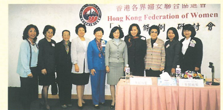
葉劉淑儀局長與婦協理事於會後合照。