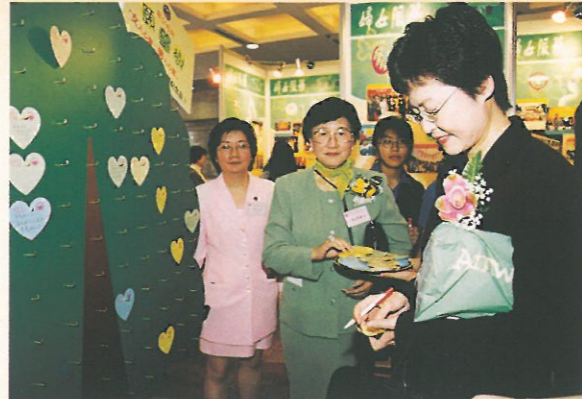
林署長為大會的心願樹寫上第一個願望：「自強不息」。