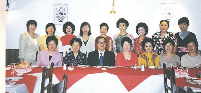
由名譽會長聯組舉辦的「澳門風情一天遊」，已於八月二十五日舉行，澳門經濟司長譚伯源伉儷(前排左三及四)及賀定一議員(前排左一)應邀出席婦協名譽會長安排之午餐。