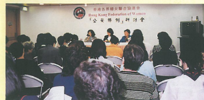
研討會當日葉劉淑儀局長主講的情況