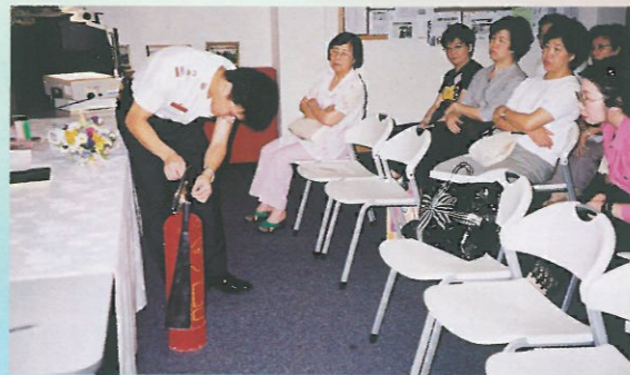
「現代女性家居管理」精裝訓練班第二班已完成。圖為消防處人員正向學員示範使用滅火筒的正確步驟。