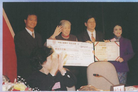
於十月十七日在北京舉行的「幸福工程五年成果匯報暨表彰會議」上，華慧娜理事代表婦協將「慈善GOLF球為媽媽」所籌得的善款支票致送，由王光美女士親自接受並回贈感謝狀。