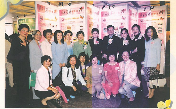
出席的婦協理事與嘉賓在展板前合照留念。