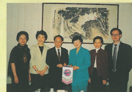
婦協代表致送紀念旗予駐紐約的張宏喜總領事(左三)。