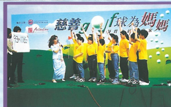
當日精彩的項目之一：小朋友的心算速度，較計算機還要快呢！