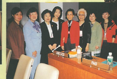
婦協代表與其他婦女代表在會場合照。