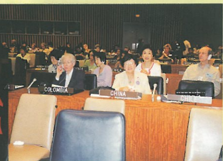
婦協代表坐在中國代表的席位。