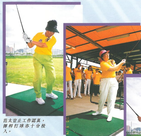
范太豈止工作認真，揮桿打球亦十分投入。