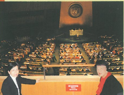
林主席及楊羅觀翠博士旁聽聯合國的會議。