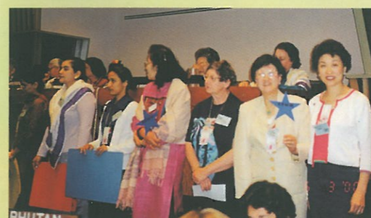
亞大區代表一起走到台前表示支持及爭取婦女權益。

婦協主席月前更連同光碟致函董建華特首、行政會議成員、立法會議員、政府各有關官員、婦協團體會員及其他非政府組織，希望政府能在落實「婦女事務委員會」之職權範圍及架構等細節前，多聽取公眾，尤其是婦女的意見。