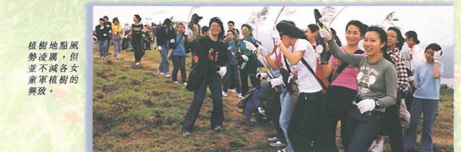
植樹地點風勢凌厲，但並不減各女童軍植樹的興致。