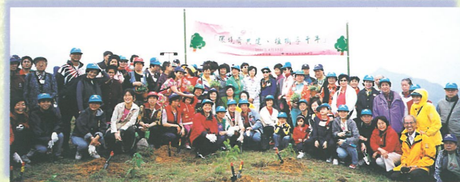
是次活動參加者超過一千人，陣容鼎盛。