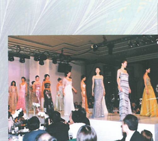
賓客們全神貫注欣賞這個多姿多采的時裝表演。