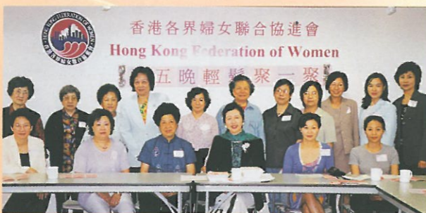
會員拓展小組於五月五日舉行「週五晚輕鬆聚一聚」，參加者均表示此聚會既輕鬆又可以讓會員之間互相增加認識。