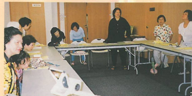
「現代女性家居管理」精裝訓練班已於六月二十四日舉行，會員們正實習如何以正確的姿勢搬起重物。