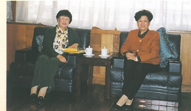
林主席於三月赴北京開政協會時，順道拜訪中國教育部部長陳至立。