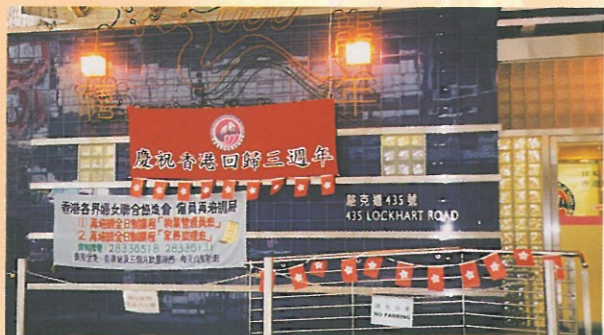
婦協如心服務中心門外張燈結綵，慶祝香港回歸三週年。