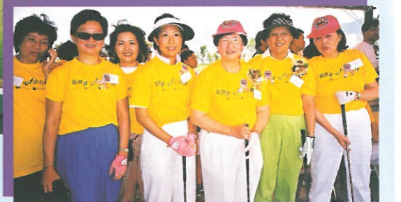
婦協代表隊參加「慈善GOLF球邀請賽」，有姿勢、有實際，並勇奪第三名。