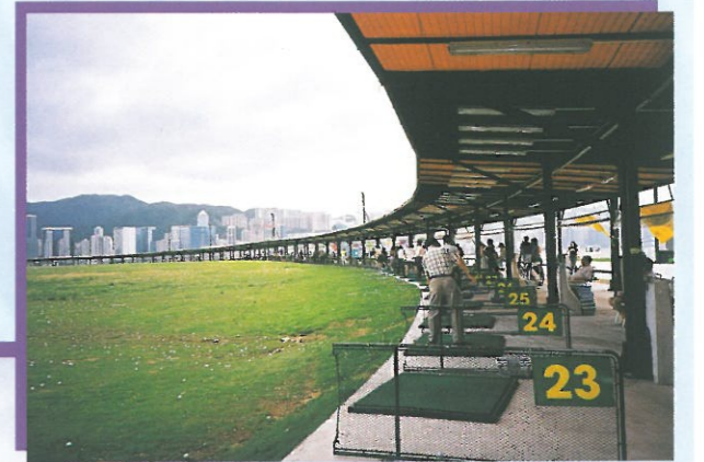
在遼闊的球場上，只要捐款贊助，便可享受整條球道。做善事之餘，亦可一嘗打高球樂趣，可謂一舉兩得！