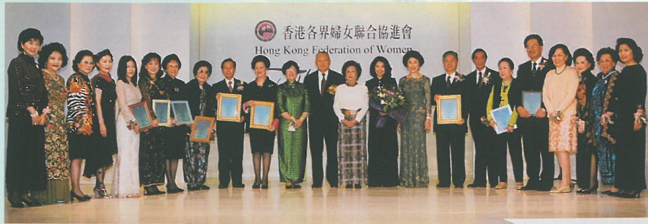
主禮嘉賓董建華伉儷與大額捐款人及召集人合照。

是次籌款晚會是婦協第一次以時裝表演晚會形式舉辦籌款活動。晚會的成功，實要向建議主辦及大力支持這個活動的大會顧問方黃吉雯議員致以衷心的謝意，同時更要向各晚會召集人盧高靜芝(會議主席)、丁毓珠、何淑賢、李楊一帆、唐尤淑圻、張紫珊、楊舒振聲、蔡馬愛娟及邊陳之娟、籌委成員何杜瑞卿、林李婉冰、林康繼弘、高李蓓蒂、黃汝璞、廖湯慧靄、劉孔愛菊、雷羅慧洪、曾黃麗群及鄭明明等多月來的努力及貢獻致謝，此外，還有 ESCADA 的贊助、配合及協助晚會製作亦居功不淺。是次晚會亦受到傳媒廣泛地報導。