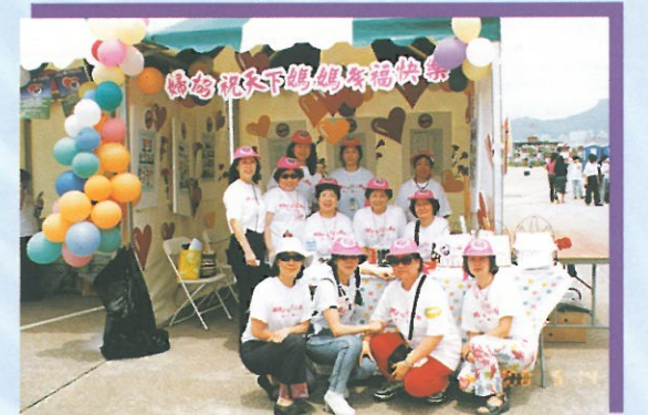
婦協義工團及職員在佈置得色彩繽紛及充滿溫馨的婦協攤位前留影。