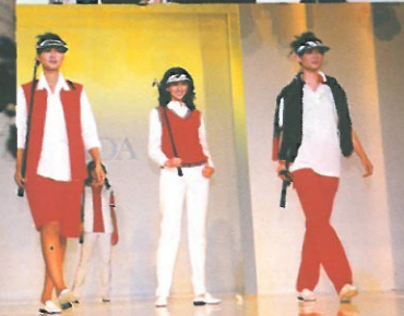
時裝品牌 ESCADA 特別製作的大型時裝表演，先以流行的運動服揭開序幕。