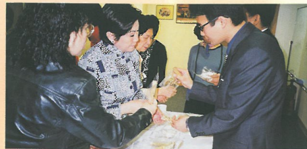
在四月八日舉行的「湯水強身益處多」活動中，會員正聆聽講者介紹藥材真偽的辨別方法。