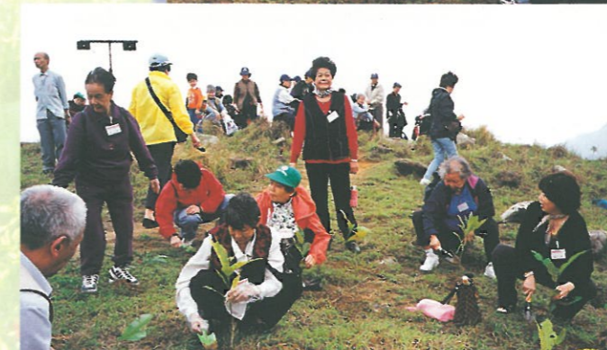
參加者非常投入地種樹，齊為美化環境出一分力。