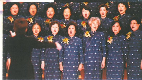
婦協合唱團高歌「回歸頌」及「大海啊！我的故鄉」，博得全場掌聲。