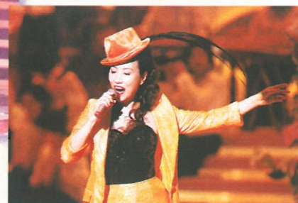
阿姐汪明荃駛出混身解數，載歌載舞賀國慶。