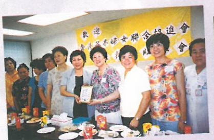
參觀元朗區婦女會