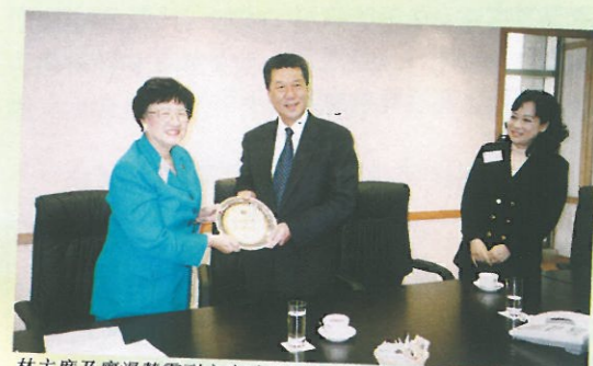
林主席及廖湯慧靄副主席致送紀念碟予何特首。