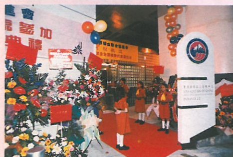
中心佈置得美侖美奐，歡迎各嘉賓光臨。