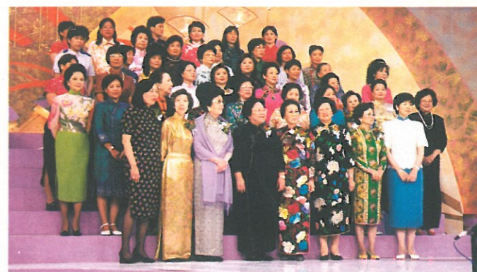
身穿七彩繽紛華服的婦協成員及嘉賓為合唱團和唱。