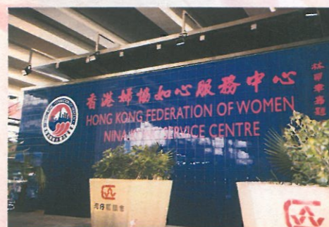
「如心服務中心」面向駱克道的外觀。

彭珮雲主席及梁愛詩司長亦分別致詞，向婦協致賀，並讚揚婦協對社會的貢獻良多。典禮中更向「一人一磚」活動之捐款人士致送感謝狀。開幕禮後並設酒會接待各位來賓，而每位到場的嘉賓更獲贈婦協為紀念五十周年國慶及如心服務中心開幕典禮而特別印製的精美首日封一個，以作留念。當日嘉賓雲集，出席盛會的包括民政事務局局長藍鴻震及其夫人、立法會主席范徐麗泰、新華社香港分社副社長陳鳳英、外交部駐港特派員夫人鄒繼純、政府要員、議員、各界賢達、婦協理事、名譽會長、副會長、婦協會員達二百多人，場面十分熱鬧。