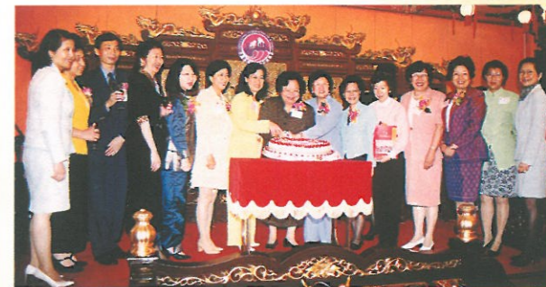
座談會完結後舉行晚宴，宋慶齡兒童基金會更送出巨型心型蛋糕，以示兩地姐妹心連心。