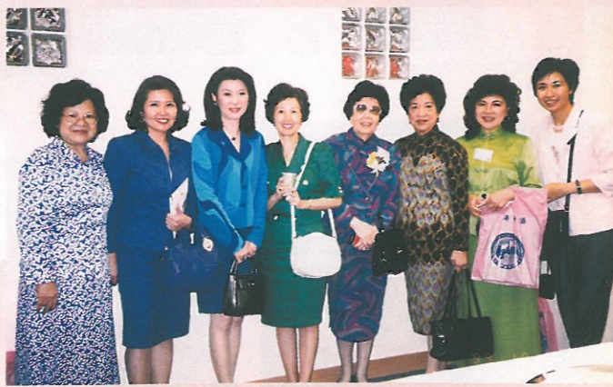
到賀的嘉賓、理事、名譽會長及會員合照。