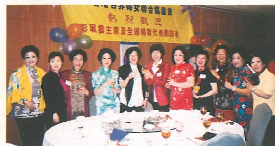
婦協理事及名譽會長在哥爾夫球場設接風宴歡迎全國婦聯貴賓。