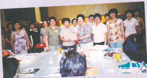
參觀屯門區婦女會