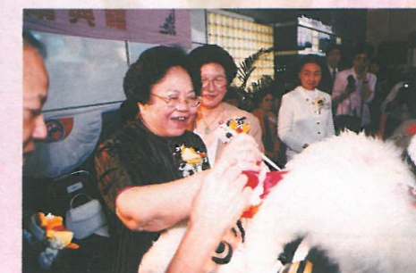
彭主席為夏漢雄體育會的醒獅點睛。