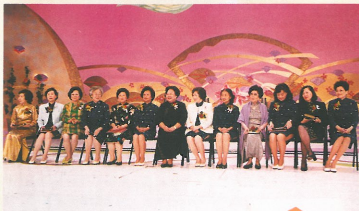
各召集人陪同主禮嘉賓主持國慶晚會的儀式。