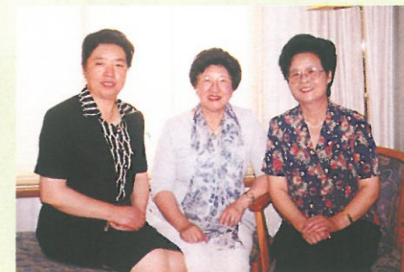
主席與蘭州市婦聯委員