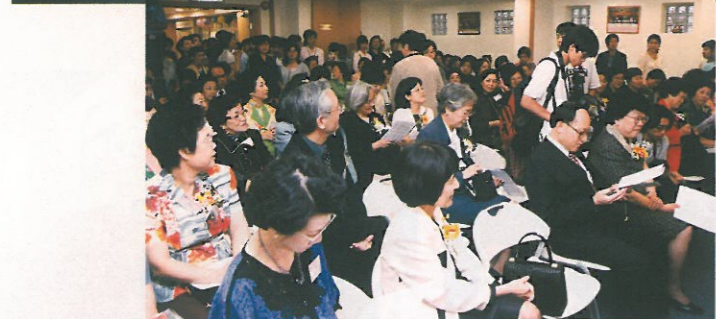
是日嘉賓滿堂，站在兩旁者大有人在。