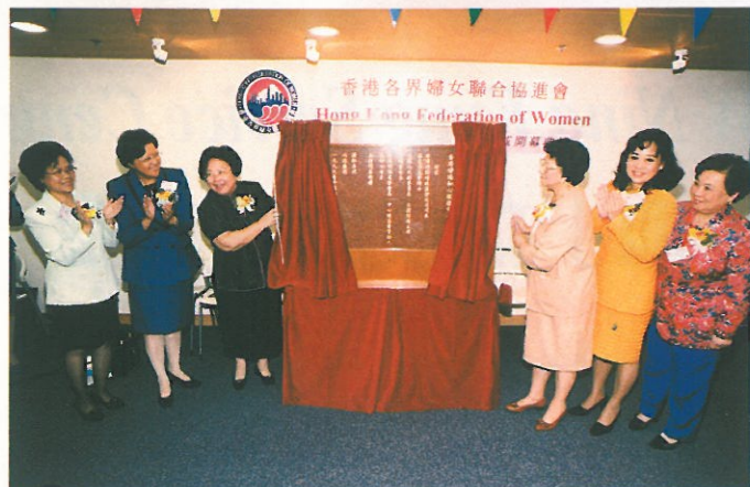
在歡樂的掌聲中，彭珮雲主席為如心服務中心主持揭幕儀式。