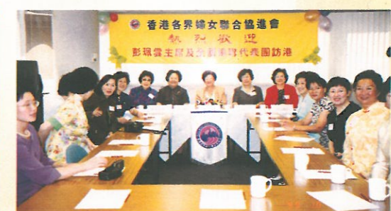
代表團更於十月四日上午親臨婦協會所參觀。