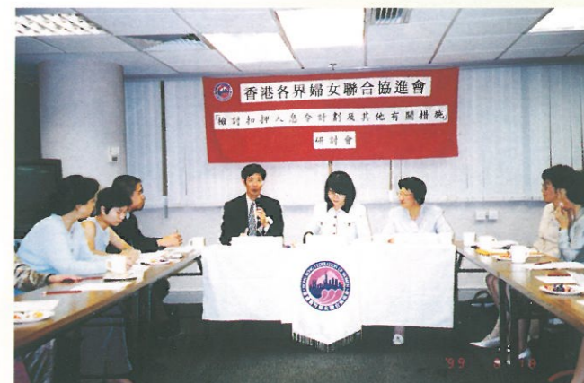
民政事務局首席助理局長關漢華先生(左一)正向參加者講解「扣押入息令計劃」的實施情況。

最後，婦協表示教育父母「持續父母責任觀念」，令贍養費支付人自願如期及如數付上贍養費，可減少贍養費欠款個案。