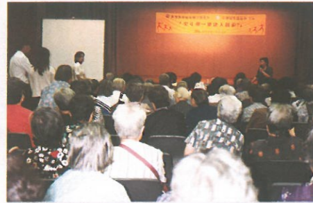
講座大受歡迎，座無虛設