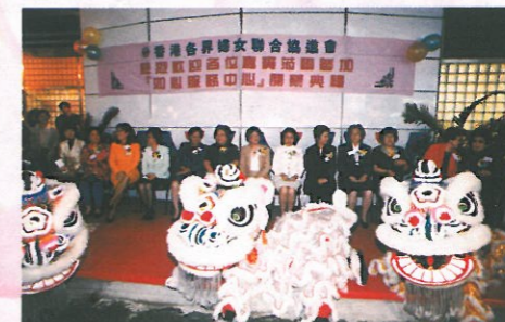
三頭醒獅為服務中心的開幕典禮平添無限喜慶氣氛。