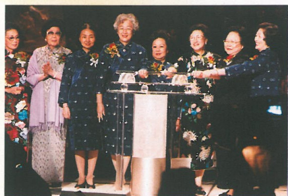
各主禮嘉賓在召集人陪同下主持亮燈儀式。