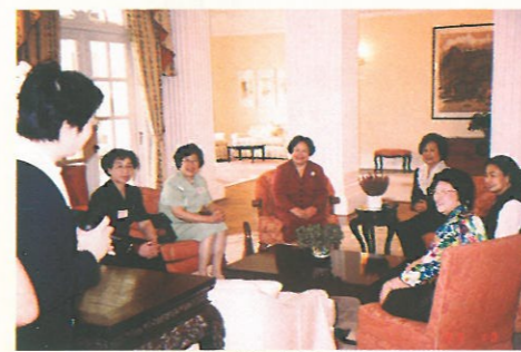
行政長官夫人董趙洪娉邀請彭主席等往「禮賓府」共聚，氣氛愉快。