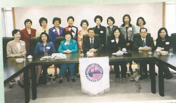
婦協代表團與何厚鏞特首會面達一個半小時,加深了解澳門各方面發展。

澳門現時人口約四十五萬,且市政工作做得相當好,空氣污染亦已受到了控制,因此代表團感受到市內四周清新的環境。葡籍的專科人士亦普遍喜歡繼續留在澳門工作,澳門本身亦給予其教育界很大的自主權,學童可享十年免費教育,對師資的培訓亦肯作出投資,而澳門青年社團的自發性很強,政府一般都很大力支持青年的各項發展及活動。