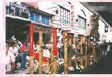
醒獅在堅拿道西表演，精彩萬分。