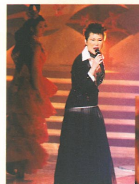
陳潔靈獻唱生動鬼馬！