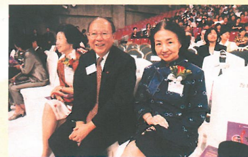
梁愛詩司長及藍鴻震局長伉儷亦親臨欣賞。