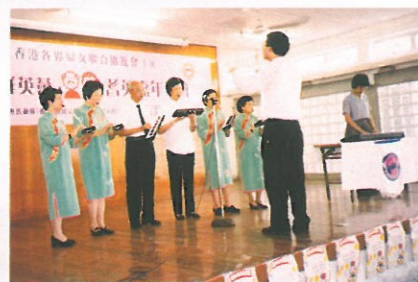
台上的表演節目一浪接一浪，圖為一班長者正在演奏口風琴，並以電子琴伴奏，悠揚樂韻，為嘉年華會增添不少氣氛

為響應「一九九九國際長者年」，社區服務小組於七月三十一日假灣仔學校舉辦了「養生強身群英薈」耆英嘉年華會。是次活動由美國惠氏藥廠(香港)有限公司贊助。當日到場的參加者近八百人，各遊戲攤位均帶有健康訊息，令長者獲得不少禮品，而「健康檢查站」更大排長龍，大會安排的量度骨質疏鬆的攤位更是大受歡迎。雖然活動當日天氣炎熱，卻沒有影響六十多位婦協義工的服務精神，大家都非常落力，令大家渡過了一個歡樂的週末。