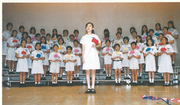
蘇浙小學，以清脆明亮的女聲獨唱及字正腔圓的唱功，令評判一致讚賞，獲得冠軍。