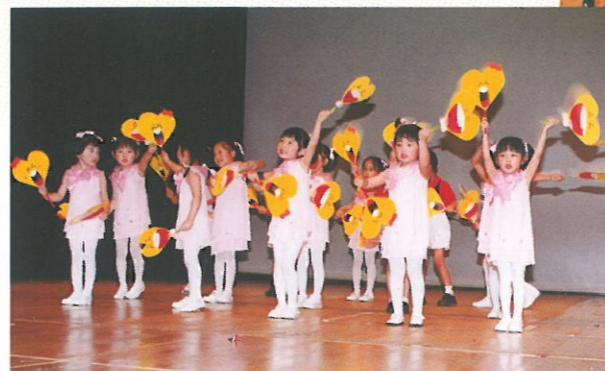
香港東區婦女福利會的幼稚園學生，精靈可愛，表演項目生動有趣，為節目增添歡樂氣氛。