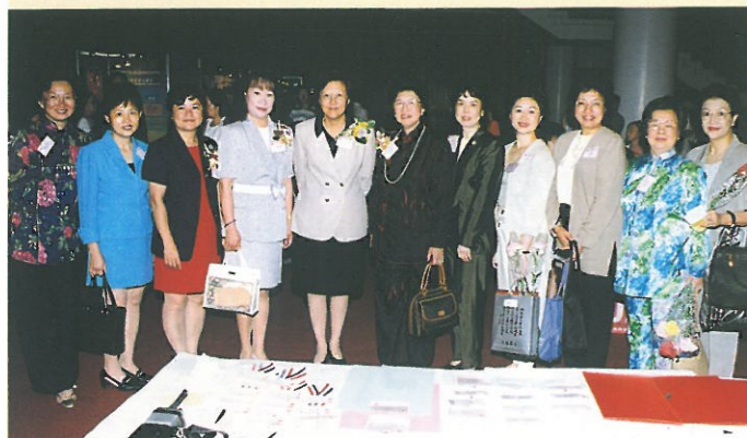
主席及婦協成員在接待處歡迎主禮嘉賓范徐麗泰。