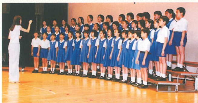
寶血會伍季明紀念學校下午校，表現不遑多讓，勇奪亞軍。