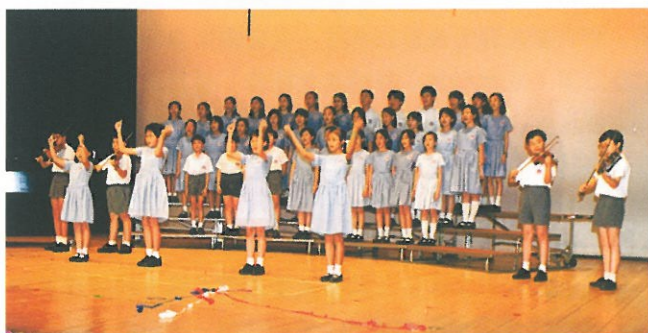
浸信會呂明才小學上午校，表演出色，獲得季軍。