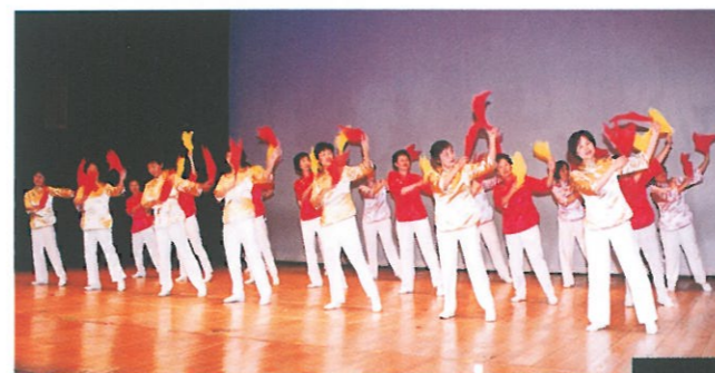
海怡半島婦女聯合會廿多位會員身穿中國服裝，以律動表演慶祝父母親節。