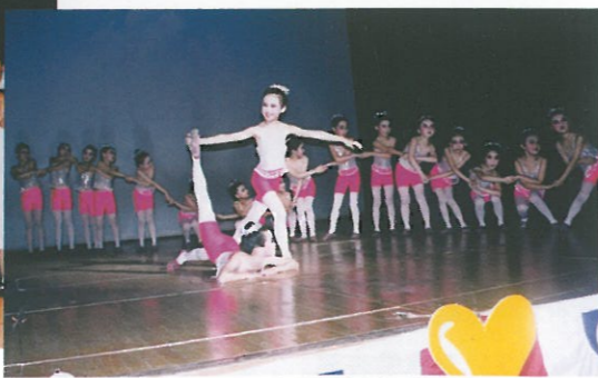
港九街坊福利會派出蘇浙小學表演「彎彎的月光」舞蹈