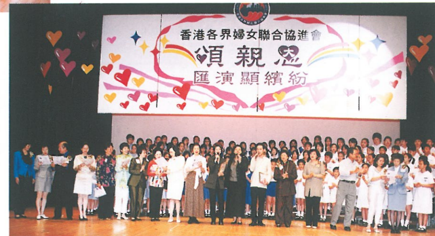
三位友情客串的嘉賓歌星帶領台上嘉賓及學生獻唱「真的愛你」，向天下父母致意。