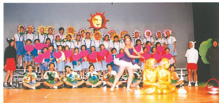
「母親的愛真情演繹」創意獎得主聖公會主恩小學，於匯演當天表演得獎項目。