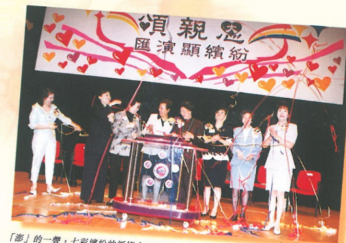
「澎」的一聲，七彩繽紛的紙條由天空降下，為「匯演顯繽紛」揭開序幕。

匯演的當日並為每位入場參加者預備了精美的頌親恩環保袋，將得獎作品編印而成的「愛的語錄」及報章特刊作為留念，而每位出席的父親及母親更獲得康乃馨絲花一枝，增添溫馨氣氛。