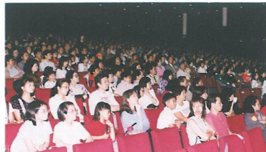
5月22日下午的香港大會堂音樂廳座無虛設，出席的人士扶老攜幼，一同支持這個有意義的活動。