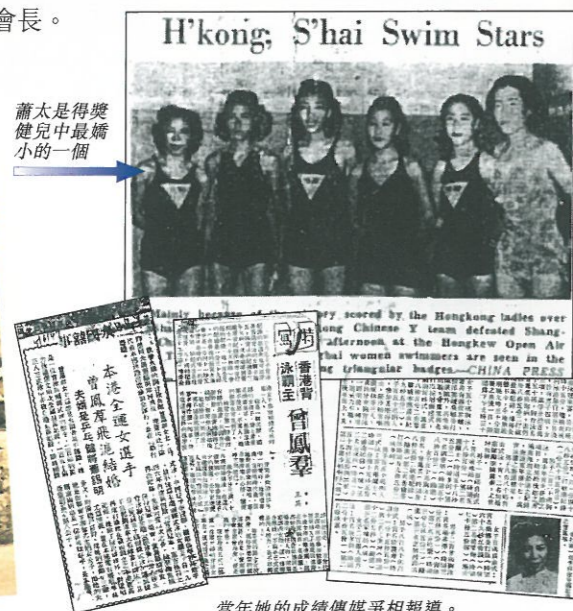
蕭太是得獎健兒中最嬌小的一個