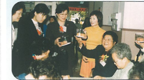
訪港團到香港西區婦女福利會關啟明紀念松鶴老人中心參觀，團長對該院老人家所做的手工藝品表示欣賞。