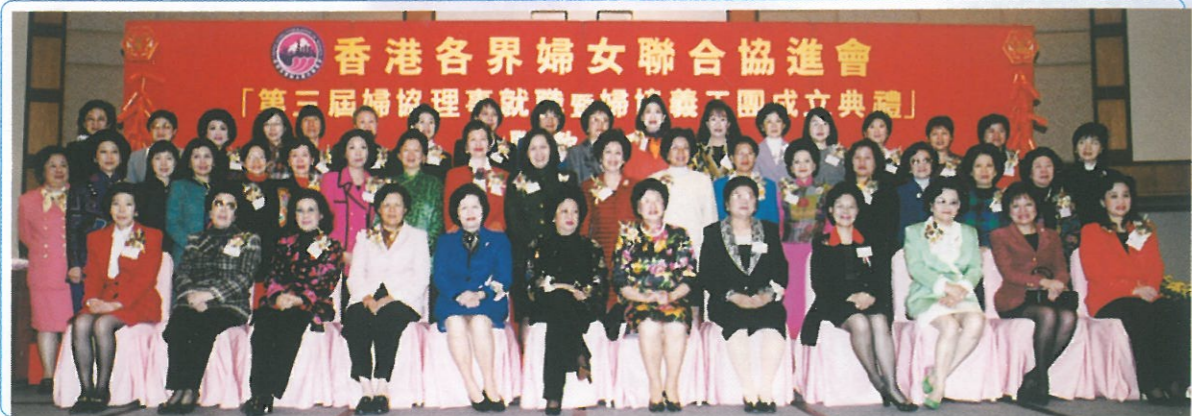
婦協第三屆理事與各主禮嘉賓近五十人於台上一張大合照，陣容十分鼎盛！