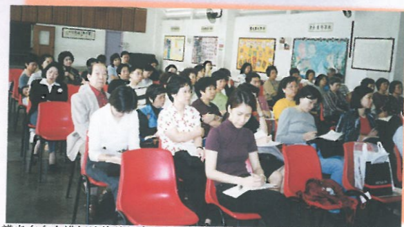
講者在台上講解法律的基本知識，參加者在台下則細心聆聽，並寫筆記。

答: 1) 立囑書人日後結婚；或 2) 立囑書人日後另立遺囑；或 3) 書面取消；或 4) 立囑書人自己或請人代撕毀或毀壞該有關遺囑