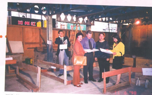
圖為數月前主席及設計師在實地視察工程及討論情況。