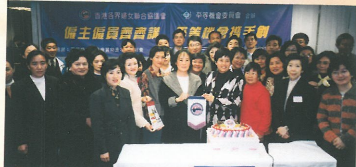
伍淑清副主席邀請了「培華教育基金會」多位內地成員到婦協參觀及出席「平等機會攜手創」活動，並與當日活動的參加者一同合照。