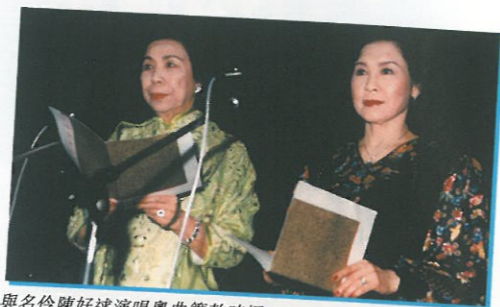
與名伶陳好逑演唱粵曲籌款時攝。