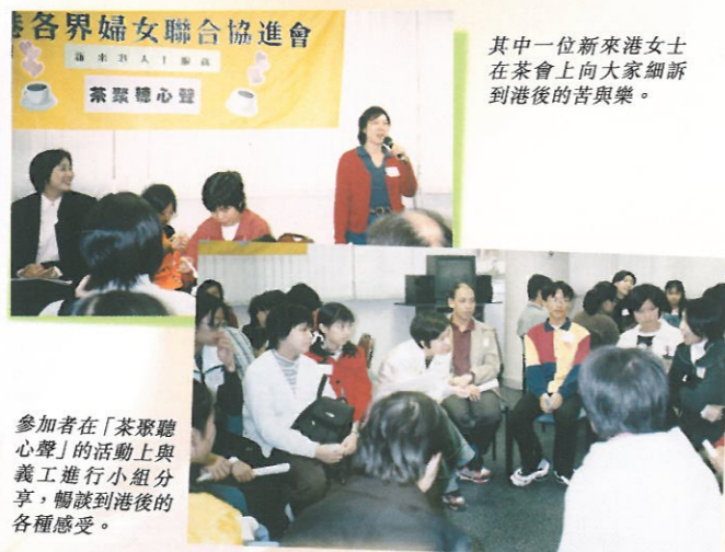
其中一位新來港女士在茶會上向大家細訴到港後的苦與樂。

大部份家庭都表示很容易就融入了香港的社會，在人際關係上亦沒有遇到太大問題。他們對現狀都感到非常滿意，因為他們認為一家人最重要的是……「一家團聚」。