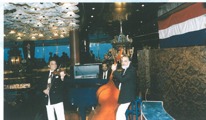
「瑪士丹號」晚宴進行時，樂隊伴奏，倍添浪漫情調。