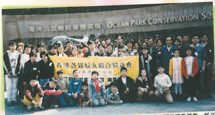
這張照片拍得真不易！小朋友一到達海洋公園，便蠢蠢欲動，要玩機動遊戲。經召集了多次，才把二十二個新來港人士家庭齊集，拍攝這張大合照。

及其家庭成員，並從他們中，得知有部份家長表示，因自己的教育水平不高，希望政府或學校可增加功課輔導班的數量和時間，讓他們的子女在學習上有更大的幫助。另外一些家庭則表示他們會積極地爭取自己所要的生活，不會抱怨得不到足夠的幫助，而是會努力向上去改善自己及家人的生活質素。