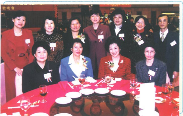
北京代表團團員與到賀嘉賓及婦協理事合照。