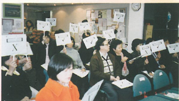
「僱主僱員齊齊講，平等機會攜手創」設有家討論部份，參加者正舉牌示意，回答問題，似乎大部份參加者對自己選取的答案部很有信心。