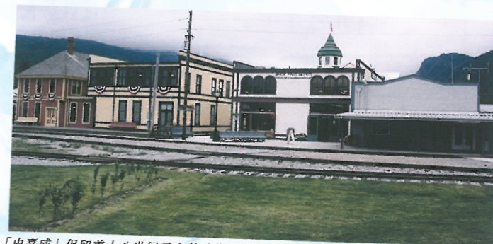
「史嘉威」保留着十八世紀尋金熱時代的建築物。