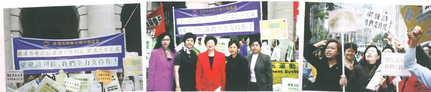
會員支持梁愛詩司長的心聲全部寫在橫額上。

們信任梁愛詩司長」、「婦女界支持梁愛詩司長」等等。婦協主席林貝聿嘉更將連日來收集到各界人士支持梁司長的五千多個簽名，交予立法會秘書長馮載祥，表達對梁司長的支持。參與是次活動的包括婦協的理事、名譽會長、名譽副會長、會員及婦協團體會員代表等。