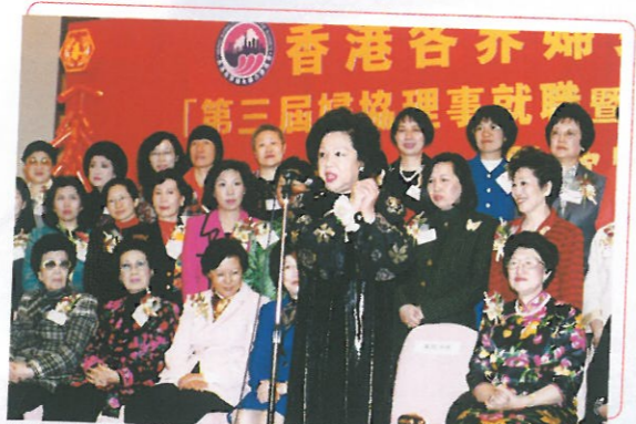
特首夫人董趙洪媻女士為晚會的主禮嘉賓，她於致辭時不忘向各位拜個早年，祝大家在新年順順利利、心想事成。