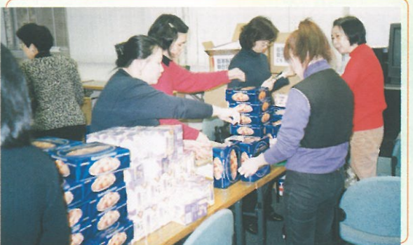
一班落力的義工除了協助包禮物外，更於晚會當日參與接待及幕後的工作。