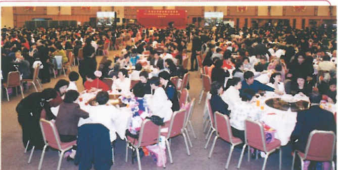
筵開一百二十席的會場被佈置得金碧輝煌，充滿了濃厚的過年氣氛。