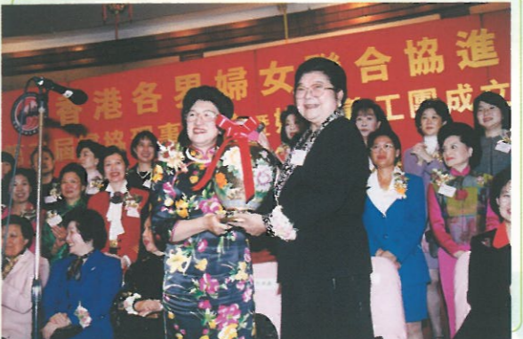
全國婦聯副主席第一書記顧秀蓮大姐特別由北京帶來一個精美的花瓶送給婦協，並在致詞時高度表揚婦協的工作。