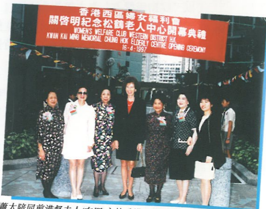
蕭太陪同前港督夫人(左四)主持香港西區婦女福利會其中一老人中心開幕。