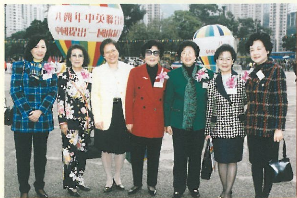
陳大姐熱烈支持婦女慶祝回歸各項活動