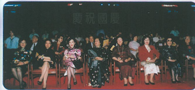
主席林貝聿嘉(右四)，晚會召集人劉孔愛菊副主席(右二)及唐尤淑圻執委(左三)，陪伴主禮嘉賓董趙洪媽女士(左四)及朱曼黎女士(右三)，律政司司長梁愛詩(左二)、新華社社長陳鳳英(左一)，及外交部特派專員馬毓真夫人(右一)欣賞節目。