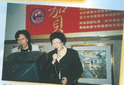
林主席及范太齊開金口高歌一曲，實是難得之極。