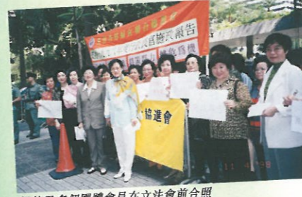
婦協及多個團體會員在立法會前合照

在立法會「政府當局回應致謝議案辯論」之當日，婦協亦有組織各方婦女到立法會門前作出支持行動。