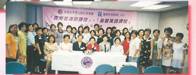
「實用普通話課程」及「基礎英語課程」的學員與嘉賓在結業禮完畢後來一張大合照!