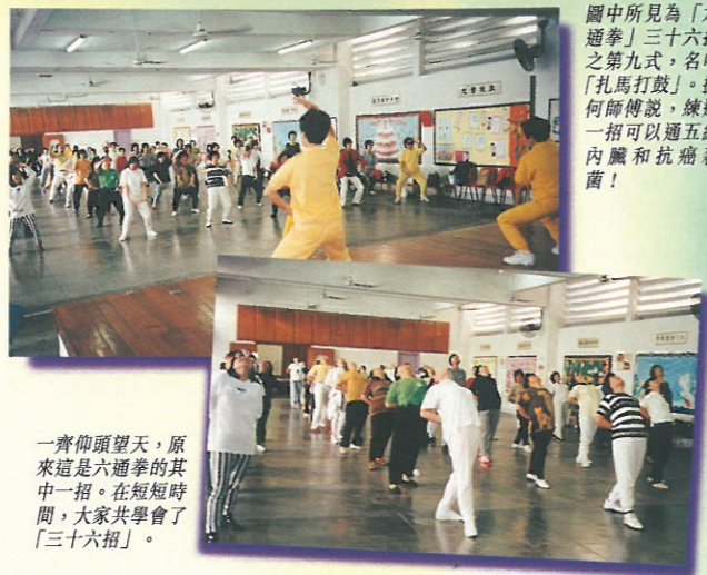
圖中所見為「六通拳」三十六招之第九式，名叫「扎馬打鼓」。據何師傅說，練這一招可以通五經內臟和抗癌殺菌！

在傾談之中，知悉她所授的「六通拳」，的確有強身健體之效。所謂「六通拳」，就是包括了三十六式的健身操，運動全身，包括兩手、兩腳、身體及頭等六部份，使各部份的血脈流通、神經系統和內分泌協調，更有助身體內循環和神經系統暢通無阻，是為「六通」。如持續性地練習，可以精神百倍，百病全消。