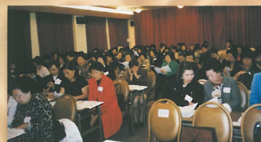
會員均非常關注及研讀會務報告