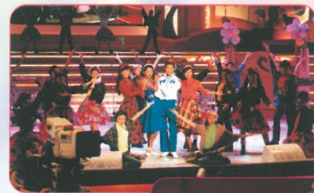
蔡少芬的男裝扮相非常俊俏，與其他女藝員演出，同樣有牡丹綠葉之效。