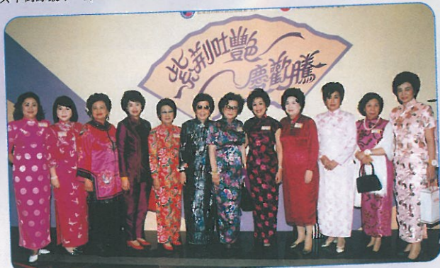
清一色全女班華服赴會，各顯綽約風姿。