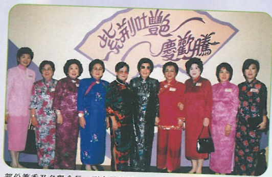
部份籌委及名譽會長，副會長合照。