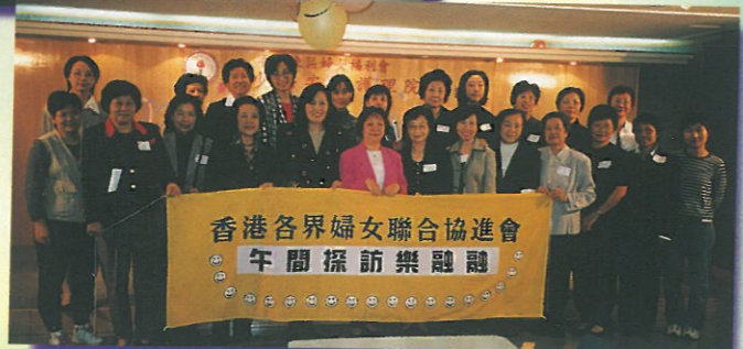
看！每位義工及工作人員都笑容滿面，就知道「做義工」的樂趣。