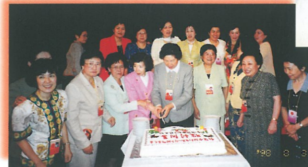
大會期間，陳慕華大姐與香港特邀代表一同切餅，慶祝大會成功舉行。