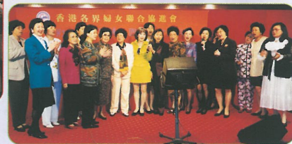
慶功聯歡宴上大家再次高歌一曲「獅子山下」。