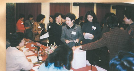
各選舉會員踴躍投票選出第三屆理事