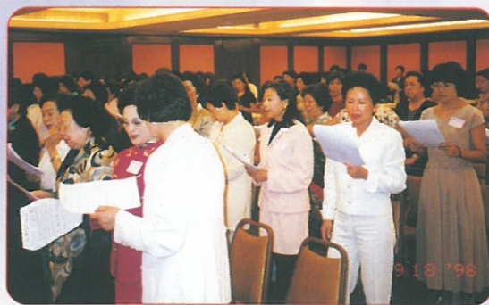
演出前大家對練習都非常認真，全情投入。