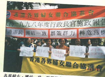
各界婦女，團結一致，群策群力，共渡時艱