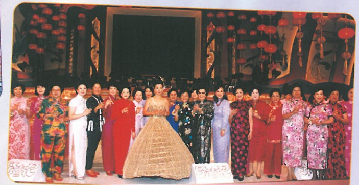
節目完滿結束，晚會召集人與眾籌委成員，在台上舉杯互相祝賀。