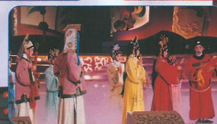
由全女班小童演出粵劇，生動有趣，劇目為「天姬送子」。