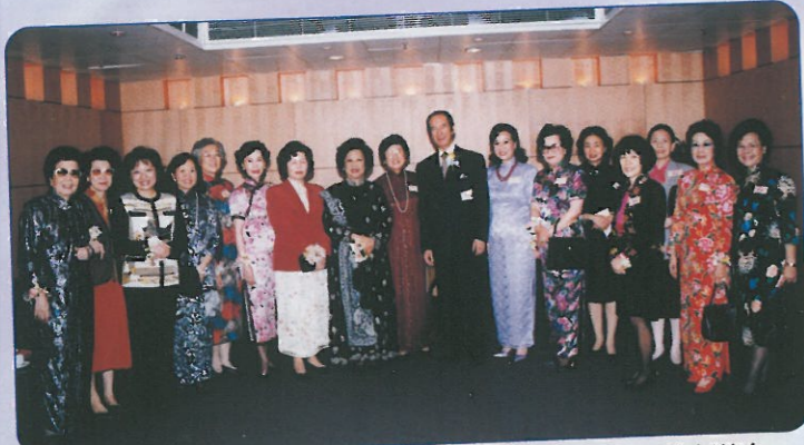
兩位主禮嘉賓董趙洪媽女士(左八)及朱曼黎女士(左七)，於酒會中與眾嘉賓來一張大合照留念，其中萬綠叢中一點紅的男士為何鴻燊博士。

是次晚會的召集人由廖湯慧靄副主席、劉孔愛菊副主席、唐尤淑圻執委擔任，她們出錢出力，功勞不淺。藉此機會更要向電視廣播有限公司台前幕後工作人員及當晚出席的嘉賓致意，並希望在明年祖國五十週年金禧慶祝晚會上再見！