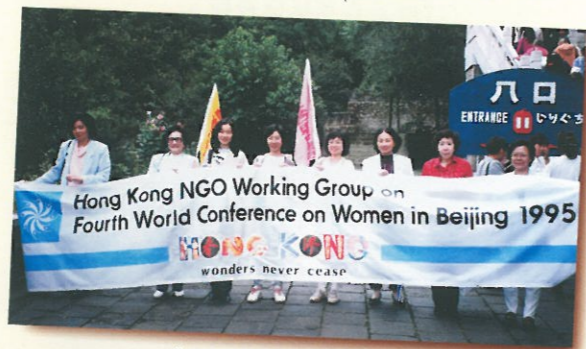
參加九五年在北京舉行之世婦會