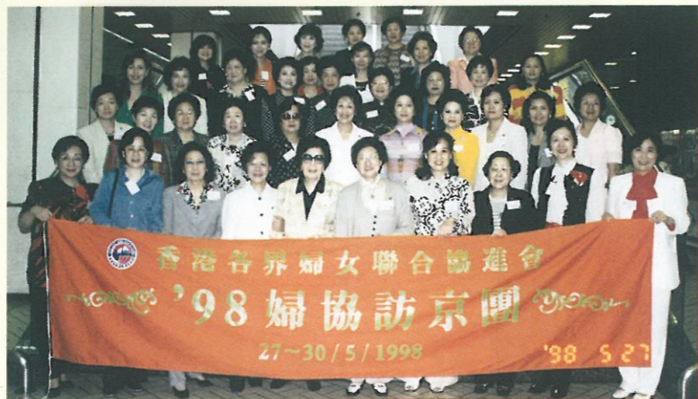
拜訪全國婦聯時,陳大姐擔任訪問團之名譽顧問