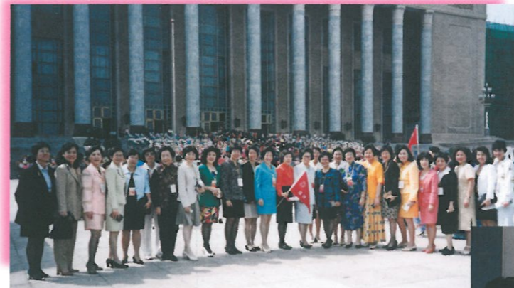
香港婦女特邀代表在進入人民大會堂出席開幕式時先來一張合照。

後記： 香港婦女一直都關心的一位全國婦聯副主席，黃啓璋大姐去年因病入院，大會期間，幾位香港代表難得有會探訪了她。據說她精神飽滿、笑容和語調依舊，她更向關心她的香港姐妹致意。未能親身探望她的香港婦女，惟有繼續向她作遙遠的祝福。