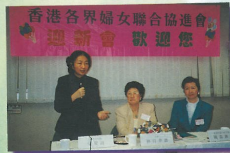
律政司司長在百忙之中抽空到來迎新會為新會員致詞鼓勵。