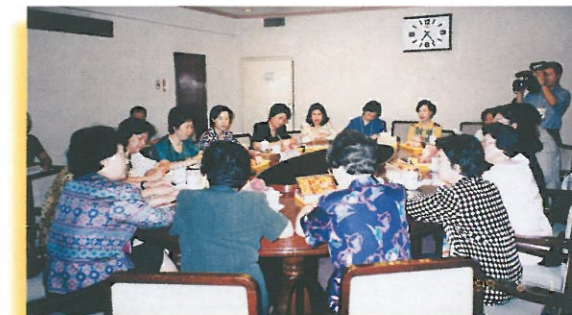
特邀代表在分組討論時積極發言。