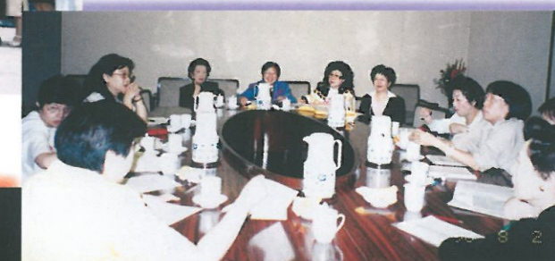
除日間分組會議外，在晚上亦爭取時間向受捐助的省市了解有關資助山區女童入學後的情況。