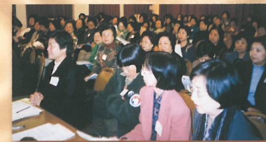
到場的選舉會員、普通會員、團體會員及名譽會長達一百五十人