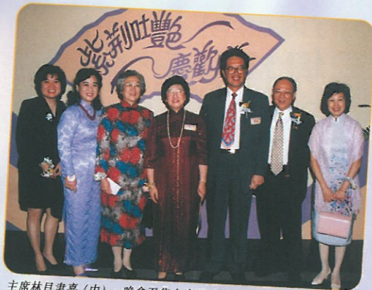
主席林貝聿嘉(中)，晚會召集人廖湯慧靄副主席(左二)，迎接到場嘉賓，民政事務局長藍鴻震(右二)及夫人(右一)，立法會議員黃宜弘先生(右三)及其夫人梁鳳儀博士(左一)，以及外交部特派專員馬毓真夫人(左三)。