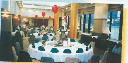
每張桌上有寫上金色「賀」字的氣球作為裝飾，為會場增添喜慶氣氛。