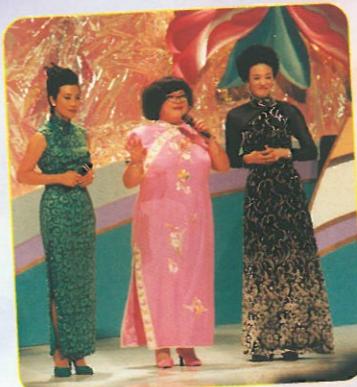
三位重量級司儀汪明荃、沈殿霞、鄭裕玲。