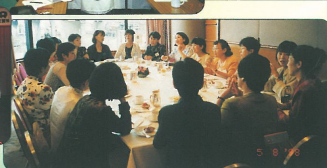
婦協理事、名譽會長及會員廿多人於八月份曾與百多位來港訪問的日本佐賀縣婦女，就生活、文化、家庭、社會等作出交流。圖為其中一分組討論時情況。