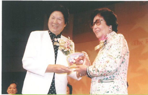
訪港團團長接受晚會召集人致送紀念品