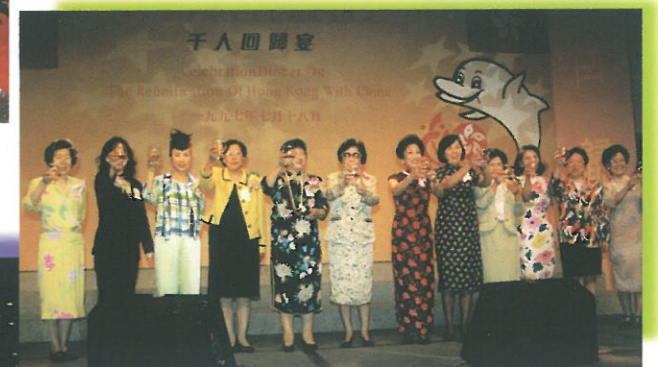
籌委會主席、副主席、秘書長及特區籌委會幾位女籌委在台上向嘉賓敬酒