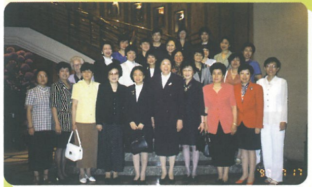
律政司司長梁愛詩代表於早餐會後與特區女官員、臨時立法會女議員及訪港團成員合照留念