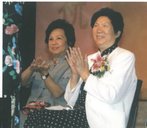
婦聯主席陳慕華女士及特首夫人、董趙洪娉女士在台上拍手祝賀晚會成功