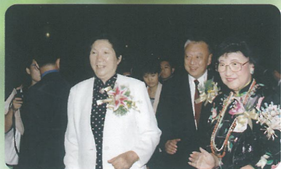
特區首長董建華先生與主席林貝聿嘉一起陪同陳慕華女士進入「千人回歸宴」會場