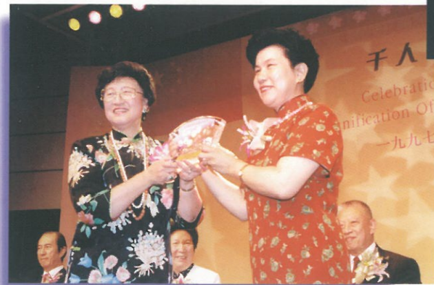
全國婦聯另一位副主席劉海榮接受大會紀念品