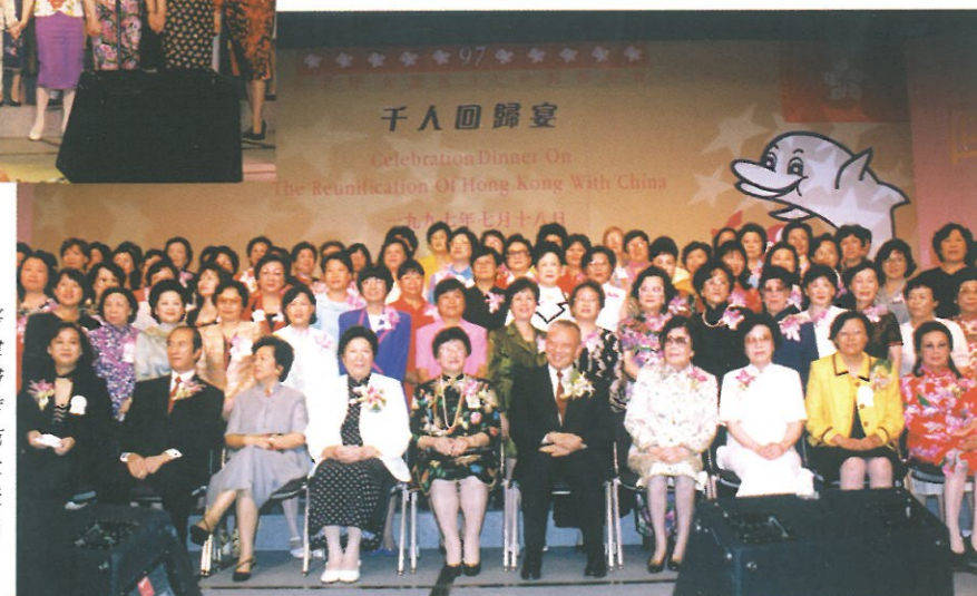
婦協主席林太與各嘉賓，包括特區首長董建華先生及夫人，全國婦聯主席陳慕華、副主席黃啟瑛、臨立會主席范徐麗泰、鑽石贊助人之、何鴻燊博士、以及各個婦女團體代表合照