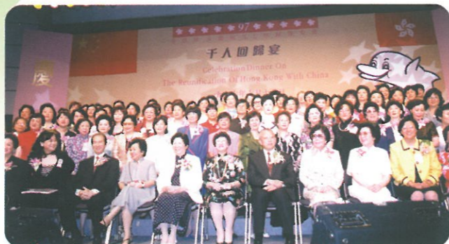
全國婦聯主席陳慕華、副主席黃啟珠在台上與眾出席嘉賓及八十多個婦女團體代表合照

七月二十日 特區行政長官及夫人在香島小築設午餐招待訪港團成員並與有份出席之官員、新華社代表及婦協代表一同切餅和合照