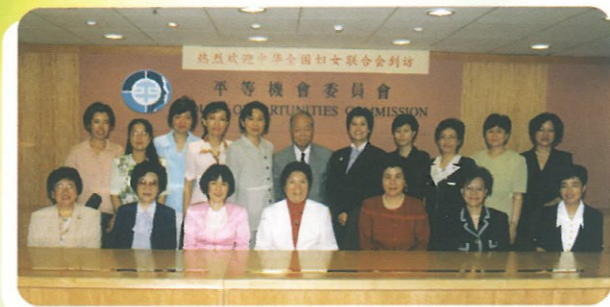
代表團成員與平等機會委員會部份委員一同合照