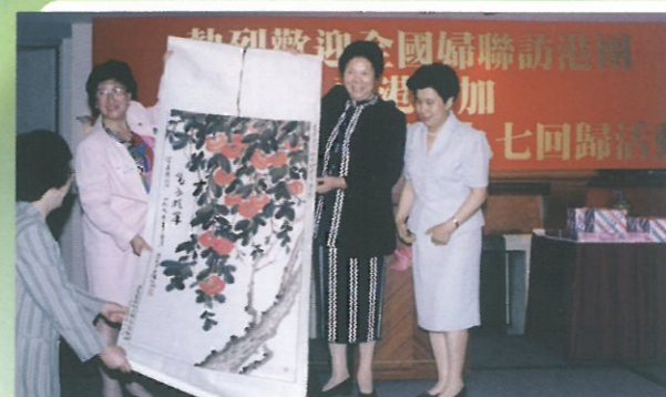
婦聯訪港團在接風晚宴上送上一幅非常生動的水墨畫給婦協