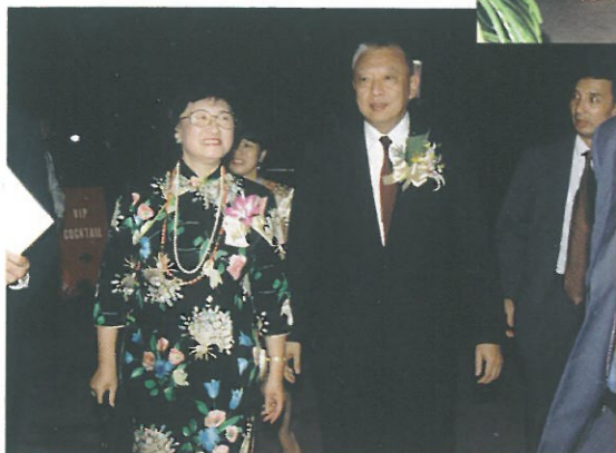
林貝聿嘉陪同主禮嘉賓董建華先生進入會展宴會廳