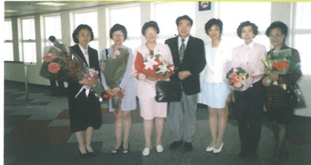
婦聯代表團到港當日，主席林貝聿嘉、副主席伍淑清、律政司司長梁愛詩、新華社朱育誠副社長、婦青部部長陳鳳英、以及政府部門代表在機場大堂等候