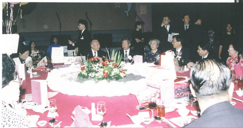
行政長官董建華先生在席間與其他嘉賓交談