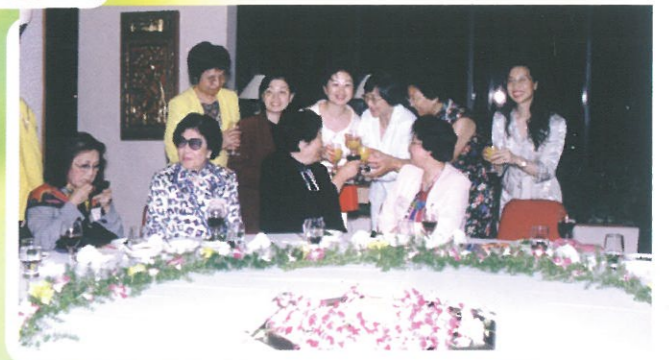
有份出席晚宴的會員頻頻到來主席向慕華大姐敬酒