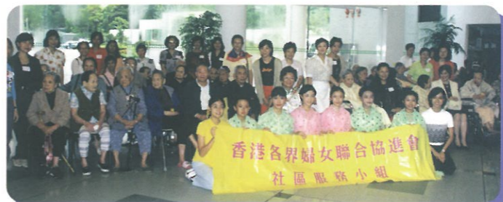
八月九日 社區服務小組到黃竹坑醫院探訪、小組成員及表演學生一同與院中老人家合照