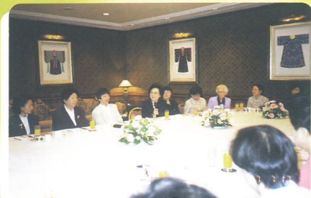
早餐會上婦聯代表與出席官員及議員作交流及彼此發表對婦女服務的意見