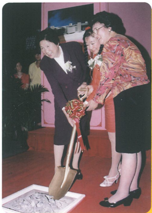
婦協龔如心婦女服務中心動土禮，全國婦聯主席陳慕華女士及龔如心女士由婦協主席陪同一同主持動土禮