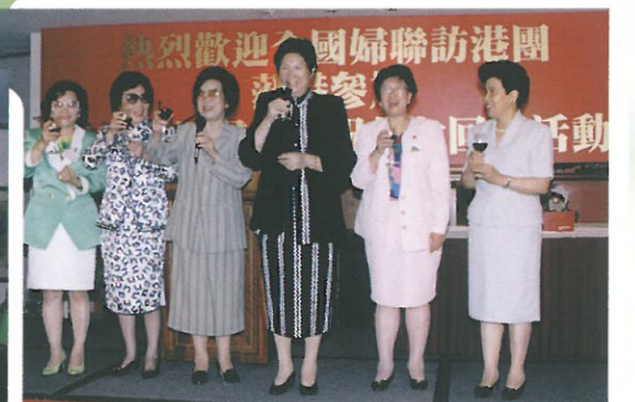
婦聯正、副主席及婦協正、副主席一同在台上祝酒