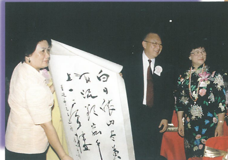
董特首在晚宴席上接過其中一位婦協會員送給他的一幅字畫