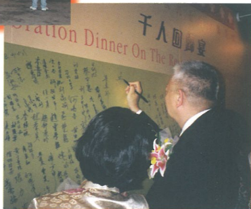
特區行政首長董建華先生抵達會場時在簽名版上留名