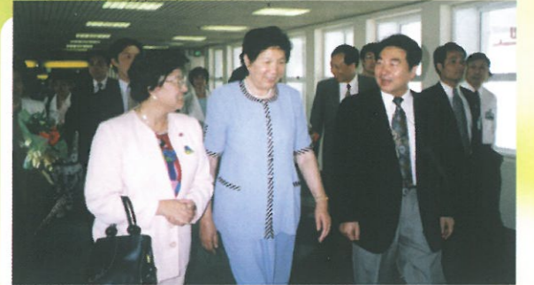
婦聯主席陳慕華女士由主席及新華社官員陪同步出機場