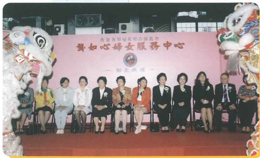
服務中心動土禮當日主禮嘉賓及中心贊助人以及其他嘉賓在台上合照

將於堅拿道天橋底興建之婦女服務中心的圖則最近獲得批准可以正式興建。故此在月前(七月十七日)舉行了一次簡單而隆重的動土禮。