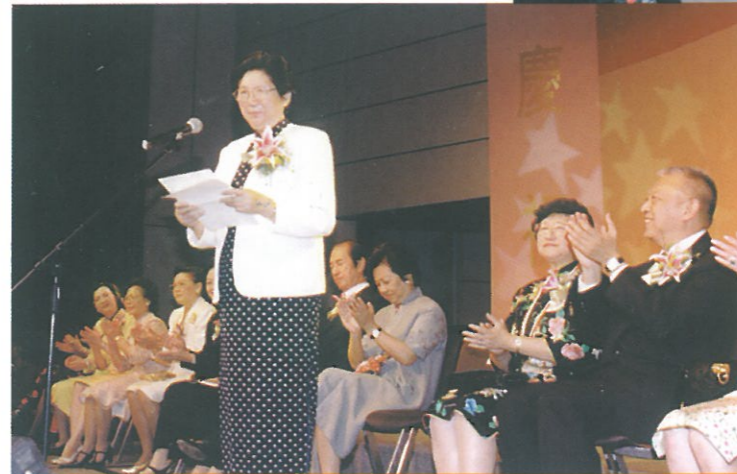
主禮嘉賓之一陳慕華女士為大會致詞