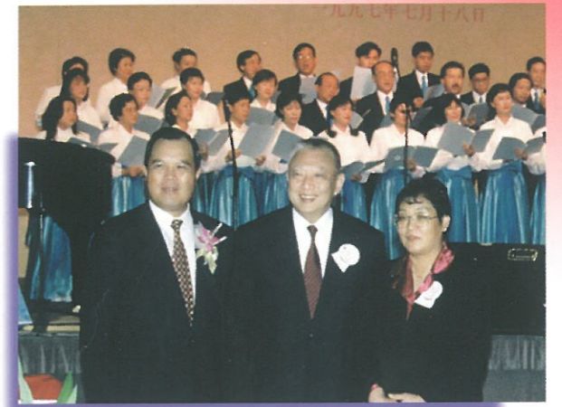
宴會中，不少嘉賓爭取與特首董建華先生拍照留念