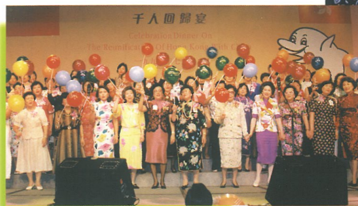
各個婦女團體代表組成的百人合唱團在台上獻唱「大中國」