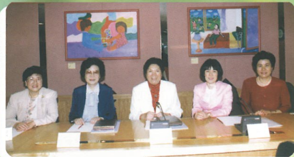
平等機會委員會主席張妙清博士接待婦聯代表團並作交流