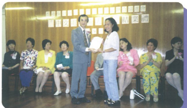
僱員再培訓局與婦協教育訓練小組合辦之「中文電腦輸入法」課程經已完成並在九月十日舉行結業禮