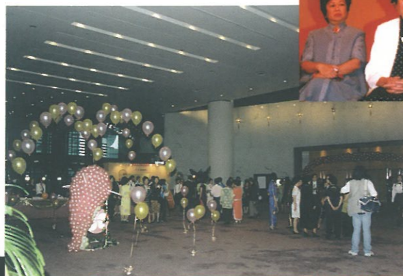
大會會場佈置加入了以汽球砌成的海豚及區徽