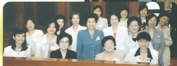
參觀臨時立法會大樓並齊齊在議員席上與幾位女議員一同拍照留念