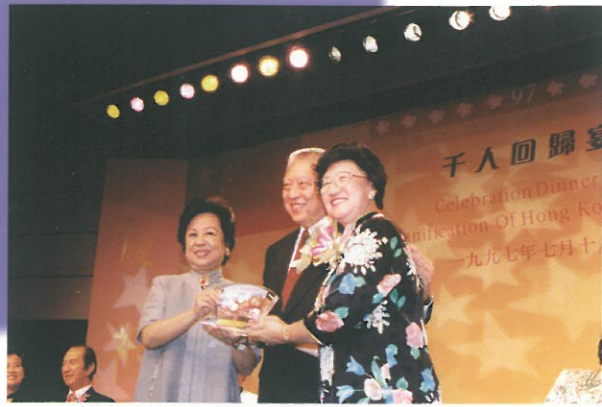
特首董建華先生及夫人接受由主席代表大會致送的紀念品