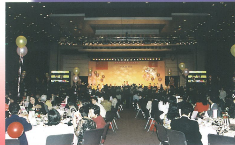
"千人回歸宴"會場內的一角、嘉賓濟濟一堂