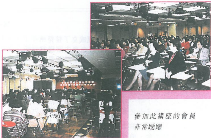
參加此講座的會員非常踴躍