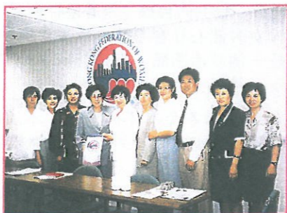
主席林貝聿嘉向蘭州婦女代表團致送紀念旗