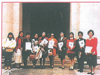
香港非政府組織籌備九五世界婦女大會工作委員會部份代表手持意見書向政府反映本地婦女的聲音

在距離參予是次大會的期間，香港非政府組織籌備第四次婦女大會工作委員會於三月廿七日就會晤了立法局政務小組，談及籌備工作情況。工作委員會表示，將斷續在香港推廣籌備工作，包括宣傳組織香港婦女到北京參加非政府組織論壇，更重要的是讓不能到北京的婦女也能認識婦女問題，爭取她們自己的權利，並把她們的訊息帶到北京去。