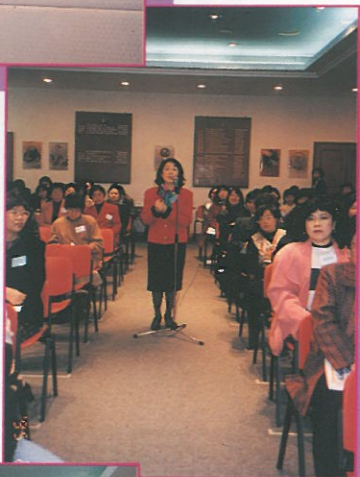
參加者積極發問及發表 自己的意見