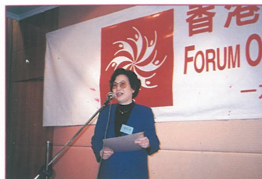
中華全國婦女聯合會副主席黃啟瓌報導有關籌備第四屆世界婦女大會工作的進情

各參加者都認為研討會內容充實，使她們更加清楚地認識婦女應關注的問題，並作為更深入研究的基礎。與會團體代表更表示她們會把研討會的成果和自己的會員分享，使更多婦女能了解她們關注的問題，並將會舉辦類似的研討會，及向政府提出改善婦女地位的建議。