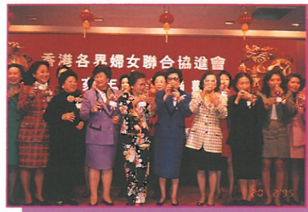
本會主席及各名譽會長、副會長、理事及執委在台上向到場嘉賓及會員祝酒