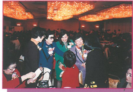
主席林貝聿嘉及名譽會長、副會長正在歡迎被邀出席的嘉賓