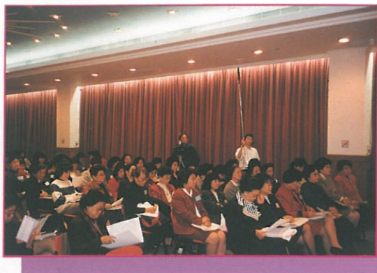
參加是次研討會的各團體代表及嘉賓 均聚精會神聆聽