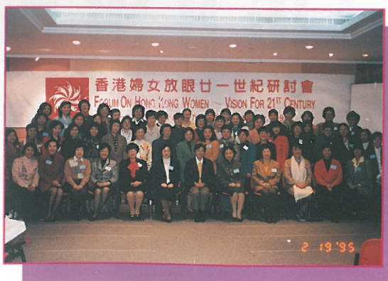
研討會的部份講者、參加者、工作人員與中華全國婦女聯 訪港代表在兩天研討會結束後一同合照