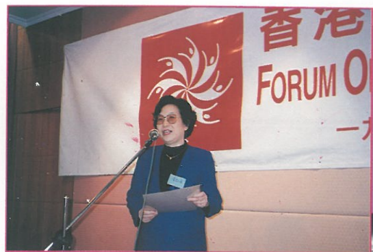
中華全國婦女聯合會副主席黃啟瑛 報導有關籌備第四屆世界婦女大會 工作的進情