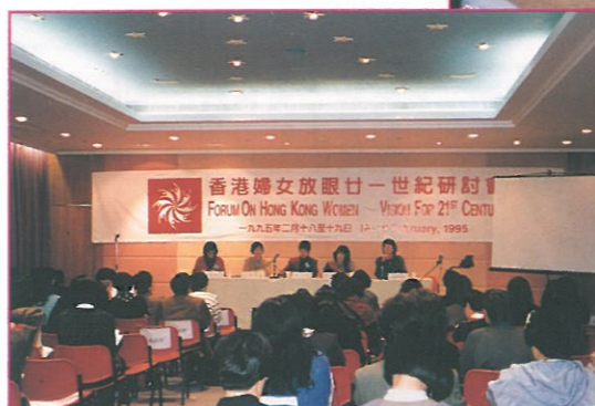
研討會第二天會議時的情形