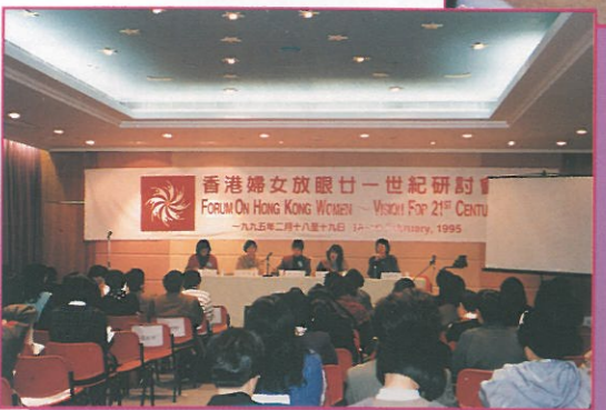
研討會第二天會議時的情形