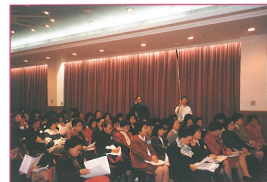
參加是次研討會的各個團體代表及嘉賓均聚精會神聆聽