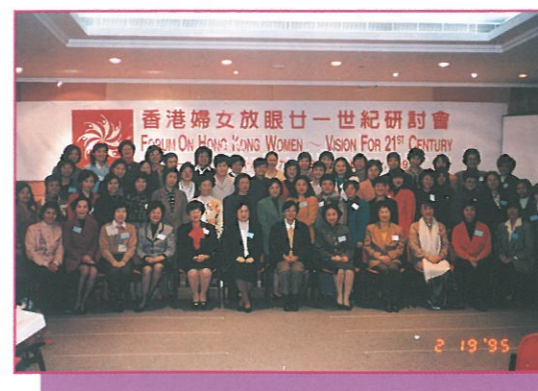
研討會的部份講者、參加者、工作人員與中華全國婦女聯訪港代表在兩天研討會結束後一同合照