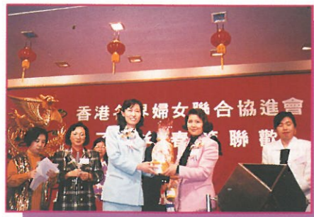
順道出席婦協聯歡的北京婦聯代表被抽中獲得維特健靈健康產品有限公司送出的‘五色靈芝’