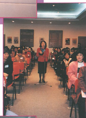
參加者積極發問及發表自己的意見