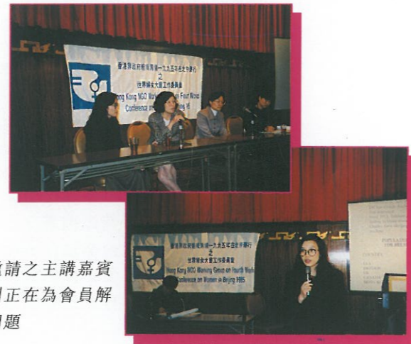
被邀請之主講嘉賓分別正在為會員解答問題