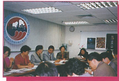
圖為主席、其他執委及理事與第二團（10-12/12）成員進行意見交流，彼此分享工作心得。