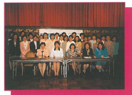
布政司署政務科代表（前排中及左二）向香港籌委會成員講解性別歧視條例草案的主旨和內容並在會後合照