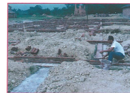
桂平市江口鎮大樟村田垌寨屯新村正砌紅磚牆