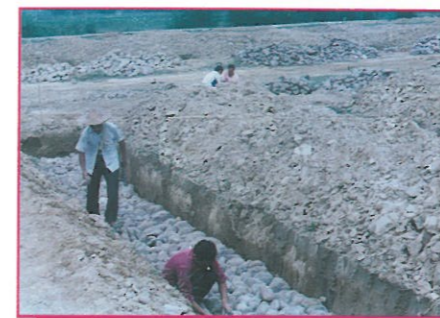
桂平市其中兩村落在九月份已開始砌石腳及隔磚