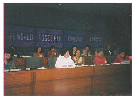
籌委會代表在曼谷舉行的ESCAP地區性會議上介紹婦協和其他組織在香港之工作