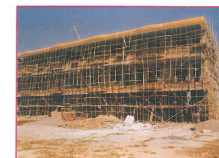
其中一間在興建中的小學將接近完工