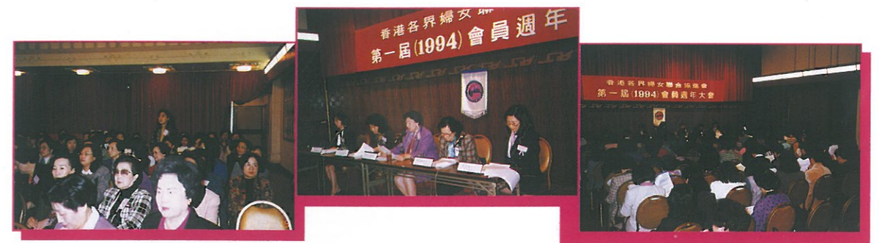
第一屆會員大會開會時之情況