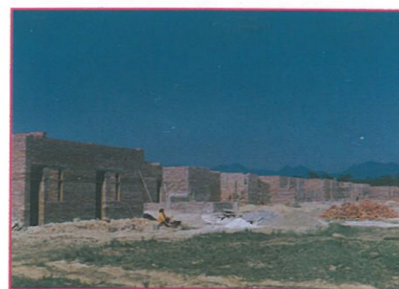
各災區興建中之房屋景況