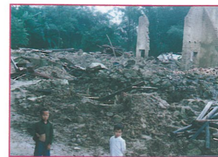
桂平市其中一村原有房屋418間，大部份已被洪水催毀之景況