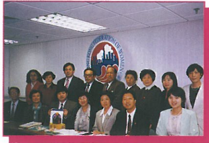
主席與第一團（4-6/12）成員齊齊拍照留念