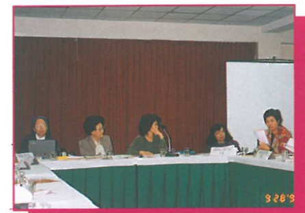
籌委會代表（右一）在第十二次亞洲及太平洋區非政府組織工作小組上派發及講解有關香港籌委會之單張內容