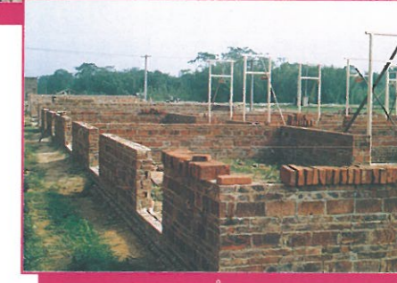
各災區興建中之房屋景況