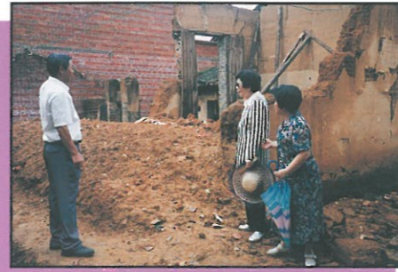
附城鎮江步管理區勒園村

註：清遠市包括清區，清新縣，英德縣，佛岡縣，連山壯族瑤族自治縣，連南瑤族自治縣，連縣，陽山縣。