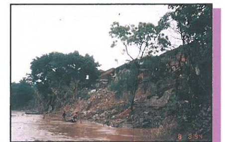
桂平水災浸上層之情況