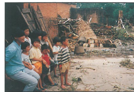
清城區附城鎮江步管理區白樓村