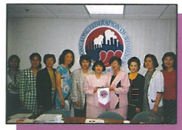
主席代表本會致送紀念旗與政務科孔郭惠清女士並與當日有份出席之名譽會長、理事於會後一同拍照

3. 八月廿二日本會多位執委理事以及名譽會長接待政務科副政務司孔郭惠清女士及首席助理政務司何淑兒小姐到訪婦協並對兩位講解婦協之工作。