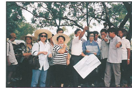
幾位籌款委員會正副主席正視察桂平市