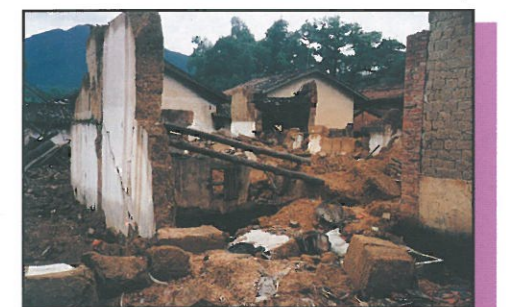
附城鎮江步管理區土岭村