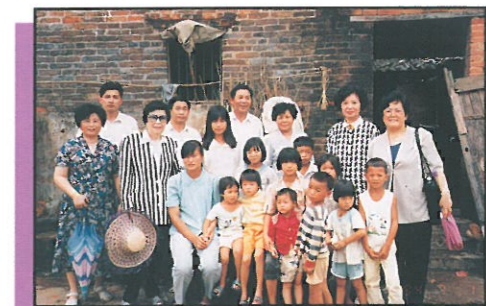
委員會主席與清城區附城鎮之災區居民合攝