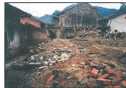
附城鎮江步管理區土岭村災區景況