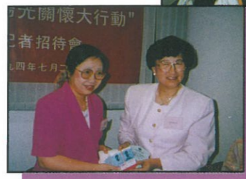
婦協“陽光關懷大行動”記者招待會社署代表接受主席致送捐助單親家庭往海洋公園之入場券及食物券

2. 本會月前為華南水災而成立之“華南賑災委員會”亦曾於八月十一日舉行記者招待會，會上包括講述委員會成員在探訪災區時之所見所聞，以及官方拍攝得到當時洪水淹蓋災區之景況，並呼籲各會員、名譽會長及副會長等響應是次之募捐。有關其觀察災區之情況詳見本季刊4-5版。