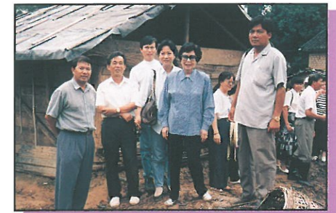
委員會主席劉孔愛菊女士視察桂平災區