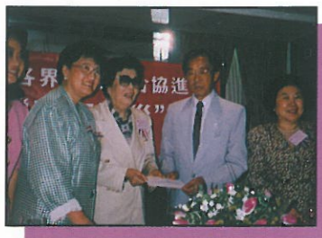
“華南賑災”記者招待會日，幾位委員會主席、副主席一同接受捐款機構、蘇浙代表送上支票

2. 本會月前為華南水災而成立之“華南賑災委員會”亦曾於八月十一日舉行記者招待會，會上包括講述委員會成員在探訪災區時之所見所聞，以及官方拍攝得到當時洪水淹蓋災區之景況，並呼籲各會員、名譽會長及副會長等響應是次之募捐。有關其觀察災區之情況詳見本季刊4-5版。