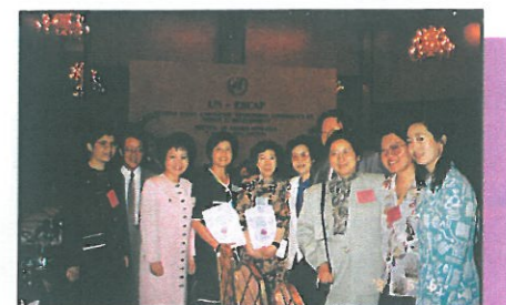
婦協代表與中國政府代表及美國政府代表於會場中合照