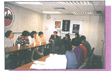
本會調查研究組及社會事務組曾邀請周永新博士為會員作討論前序言。