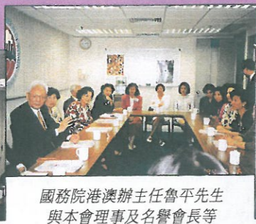
國務院港澳辦主任魯平先生與本會理事及名譽會長等交談時攝