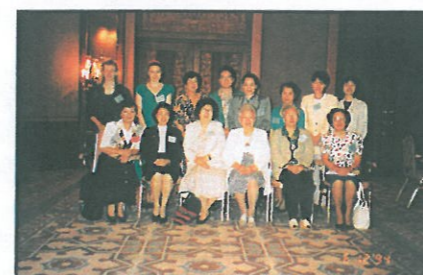
婦協代表與東亞地區非政府組織代表合照