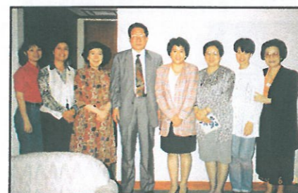
婦協代表與中國政府代表團：國務院副秘書長徐志堅先生、北京市副市長何魯麗女士、中華全國婦聯副主席黃啓瓊女士及香港政府代表：首席助理政務司何淑兒女士合照