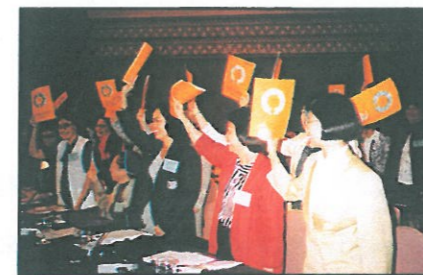
非政府組織代表於會場中學起給各國政府的意見書