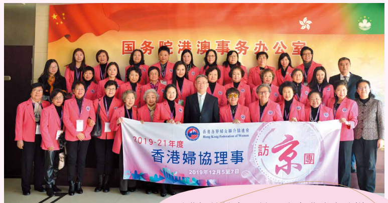
香港婦協訪京團於國務院港澳事務辦公室前與副主任宋哲(前排右7)合影。

At the Banquet served after the seminar at the Great Hall of the People hosted by ACWF.