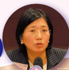
趙慧賢女士 (申訴專員)