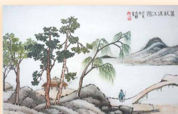
仿古山水 李有群 (69 x 45cm)