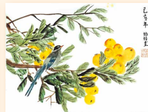
枇杷山鵲 曾培楨 (46 x 34cm)