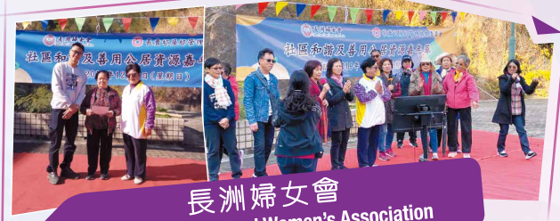
長洲婦女會 Cheung Chau Island Women's Association

該會在關愛的社區活動中秉持以往展望將來，在各方面都得到了很大的提升和發展，彰顯出自強不息，堅韌、剛毅、智慧、豁達的新時代女性風采。衷心感謝各位繼續大力支持。