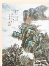
山水 趙譚惠冰 (66 x 45cm)