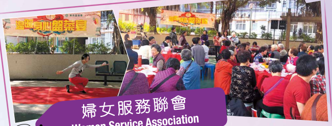
婦女服務聯會 Women Service Association

該會於2019年12月14日下午假葵涌葵芳邨舉辦「溫暖身心盤菜宴」，活動內容包括：盤菜宴、社區團體及人士表演、抽獎等。區內居民踴躍參與，度過一個愉快週末。