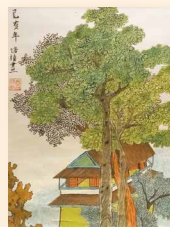
工筆山水 曾培楨 (34 x 45cm)