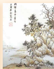
仿憚壽畫作 蘇玲寬 (34 x 45cm)