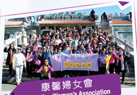
康馨婦女會 Carnation Women's Association

該會於2019年12月14日下午假葵涌葵芳邨舉辦「溫暖身心盤菜宴」，活動內容包括：盤菜宴、社區團體及人士表演、抽獎等。區內居民踴躍參與，度過一個愉快週末。