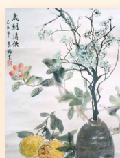
歲朝清供 譚美端 (45 x 68cm)