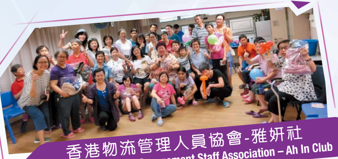
香港物流管理人員協會-雅妍社 Hong Kong Logistics Management Staff Association - Ah In Club

該會於2019年11月3日舉辦《金秋歡樂一天遊2019》，行程第一站參觀全新活化粉嶺裁判署，認識它之前的功能及改變後的面貌，午膳在圓玄學院享用清新健康的素宴。之後前往60年代著名南豐紗廠，工廠的規模在當時數一數二，提供了不少工作崗位給大眾。燕窩是眾所皆知的名貴補品，最後一站安排了參觀名冠燕窩莊，讓大家在這方面多認識了解。