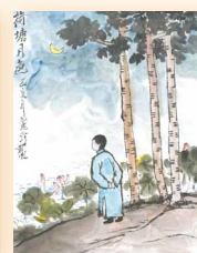
荷塘月色 高麗珍 (25 x 34cm)