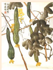
瓜瓞綿綿 陳靄群 (45 x 60cm)