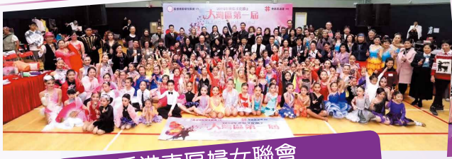
香港東區婦女聯會 Hong Kong Eastern District Women's Association

該會於2019年12月29日舉行「2019年東區文化節第一屆大灣區拉丁舞及標準舞比賽」，東區文化節是東區每年舉辦一個重要的活動，讓東區市民能夠參與及欣賞不同藝術和表演，豐富了市民文娛康樂生活。該會亦於2019年12月2日舉行「慶祝中華人民共和國成立70週年暨第三屆執行委員會就職典禮」聯歡晚宴，多謝各界社會賢達，社區領袖，各位姊妹及屬會等等的支持，使晚宴圓滿舉行。