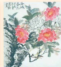
洛城春色 黃潔齡 (60 x 67cm)