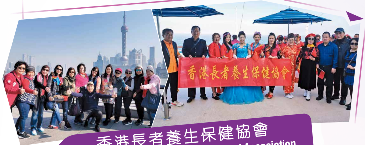
香港長者養生保健協會 Hong Kong Elders Health Development Association

該會於2019年12月8日由長貴邨屋邨管理諮詢委員會資助本會舉辦「社區和諧及善用公屋資源嘉年華」活動，當日活動內容包括跳舞、歌唱及卡拉OK表演等節目，場面非常熱烈高興。