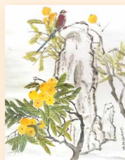
枇杷雛鳥 陳秀英 (35 x 45cm)