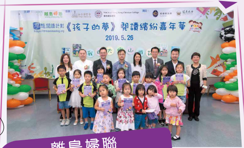
離島婦聯 OIWA Women's Association