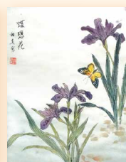
蝶戀花 李鍾甜英 (34 x 46cm)