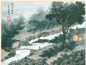
仿沈周畫作 蘇玲寬 (45 x 35cm)