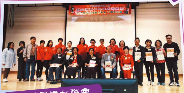
香港基層婦女聯會 Hong Kong Women of Alliance

該會於12月30日下午二時至五時假啟德社區中心會堂舉辦「發光發熱在社區」，慶祝第24周年會慶及義工頒獎典禮，當天主禮嘉賓邀得中聯辦九龍工作部張翰科長出席，當日活動包括懷舊金曲、利是幸運抽獎，參加者可獲禮品一份，共有超過200人出席，場面熱鬧。