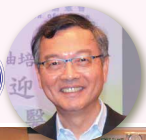
林正財醫生 (安老事務委員會主席)