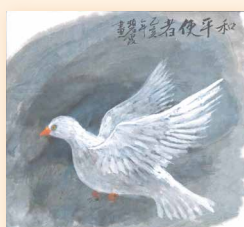
和平使者 梁碧霞 (41 x 38cm)