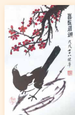
喜在眉頭 楊健華 (28 x 43cm)