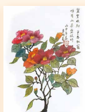
茶花 趙譚惠冰 (34 x 45cm)