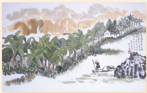
蕉林 趙譚惠冰 (69 x 43cm)