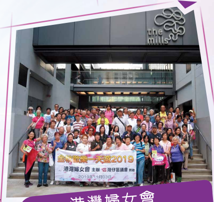
港灣婦女會 Wanchai District Women's Association

該會於2019年12月8日舉辦之「冬日逍遙樂」活動完滿結束，當日天朗氣清，參加者暢遊長洲各大景點及品嚐各種美食，歡度了一個愉快週末，特別鳴謝「灣仔區議會」贊助此活動。