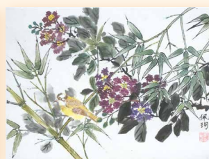
紫薇白頭 鄭佩珣 (45 x 35cm)