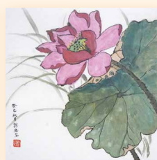
荷花 劉艷容 (34 x 36cm)