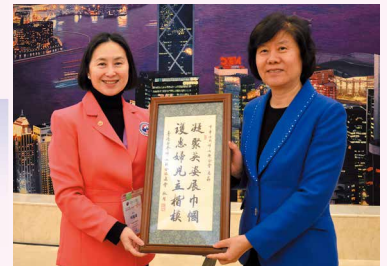
婦協主席何超瓊(左)致送紀念品予全國人大副委員長、全國婦聯主席沈躍躍(右)。

President Ms. Shen remarked that ACWF would continue to support HKFW as the representative of the Hong Kong patriotic women organization, working effectively to subdue terrorism, to restore law and order, to contribute to its prosperity and stability, to strengthen the liaison between women in Hong Kong and those in the international arena for exchanges and cooperation so as to safeguard the Nation's sovereignty; safety and development.