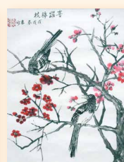
喜上梅梢 趙譚惠冰 (34 x 44cm)