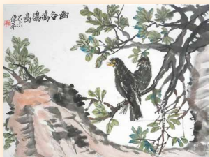
幽谷鴿鳴 曾偉平 (45 x 34cm)