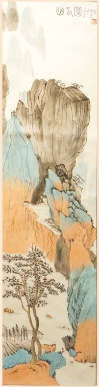
幽居圖 李鍾甜英 (33 x 137cm)